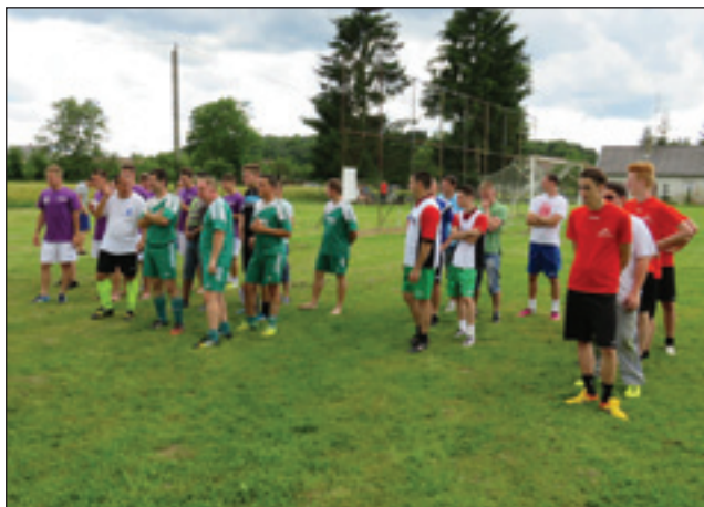
Letošnji turnir DSS je bijo na Dolenjom Seniki

pa tau vküper z domanjov, lokalnov narodnostnov samoupravov. Vidimo, ka so tü zvekšoga mladi. Dobro je,