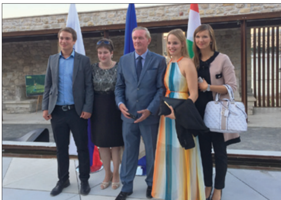
Minister za Slovence po svetu Gorazd Žmavc z mladimi Porabskimi Slovenci

skemu narodu zgodovina in usoda nista namenili zaokrožitve celostnega narodnega ozemlja v mejah svoje lastne nacionalne države. Vendar smo v prvih 25. letih skupaj dokazali, da slovenstvo presega državne meje, da je slovenstvo v srcu« - je svoj nagovor začel član Vlade RS in še dodal, da so Porabski Slovenci »most kulturno-gospodarsko-političnega povezovanja med državama«. Visoki gost je še izpostavil, da sosednji državi poleg narodnostnih skupnosti združujejo tudi načela varovanja človekovih pravic, miru in demokracije. (Gorazd Žmavc se je tekom dneva sestel z madžarskim sopredsedujočim slovensko-madžarske manjšinske mešane komisije Ferencem Kalmárjem in se z njim dogovoril za okvirni datum zasedanja na koncu leta 2016 v Budimpešti. Naslednji dan je usklajeval s predstavniki madžarske prestolnice o sodelovanju v Podonavski regiji.) Obe obmejni narodnostni skupnosti sta se v Budimpešti predstavili z lastno kulinarično ponudbo. Tako smo na mizah videli porabsko ajdovo torto, zavitke in jabolčni sok, pokušali pa smo lahko žlahtno kapljico iz Lendavskih gor. Glasbeno spremljavo ob svečanem dogodku so zagotovili mladi člani ansambla »Veseli goslarge« iz Budimpešte, ki so kljub svojemu madžarskemu poreklu prijetno preigravali uspešnice bratov Avsenik. V knjigo pri vhodu na prizorišče je lahko vsakdo vpisal svoje želje in čestitke državi jubilancki.