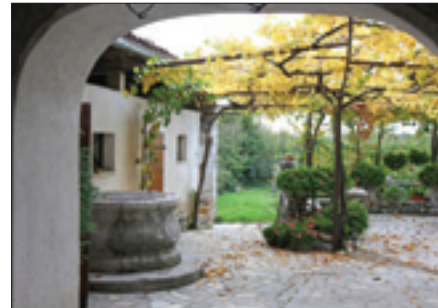
Borjač s štirno

tom, lahko pa je kritina zložena le s slemenjaki na strehi. Zidovi ob javnih zgradbah so zidani iz masivnih klesancev, zaključek na vrhu zidu pa krasi kamnita plošča, ki ji pravijo kapa . Tako bogata zidava daje trdnost in predvsem trajnost arhitekturnemu elementu. Kamniti zidovi pa so prav tako svojevrstno »bivališče«, ki dajejo zatočišče mnogim živalim in rastlinam – bršljanu,