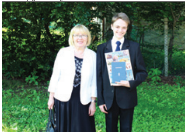
Z mamo po podelitvi spričeval. Ker sem postal odličnjak sem dobil tudi knjigo za darilo.

Začenjajo se dolge poletne počitnice, v katerih imam veliko načrtov. Prvi teden bom povabil prijatelje na pico in šel bom obiskat dedka in babico. V začetku julija bom šel na jezikovni tabor v Fieso. Ko bom prišel domov, bom doma samo pet dni, zato ker bom šel na družinski dopust na morje v Rogoznico. To je na Hrvaškem, kamor vsako leto hodimo počitnikovat. Oh, kako mi bo lepo! Seveda, prebrati moram tudi knjige za obvezno branje pri madžarščini in slovenščini. To šolsko leto se je uspešno in srečno končalo. Upam, da bo tako tudi v 8. razredu. Vem pa, da se bom moral za to sam potruditi.