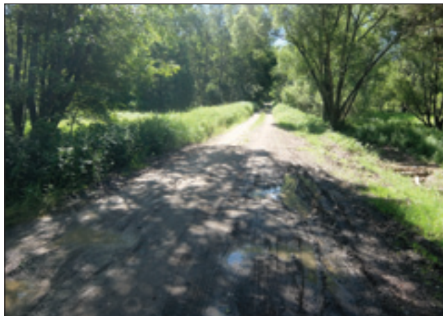
Zaraščena dolenska paut pri Andovci

- Spomnite se, kak so vozili pšenico pa žito Andovčani pa lidgé iz drugi sausedni vasnic v Porabji v mlin na