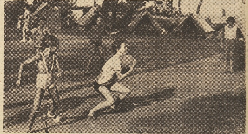
V taborišču »Partizana« Narodni dom je vsak dan živahno, mladini pa je najbolj priljubljen rekvizit žoga