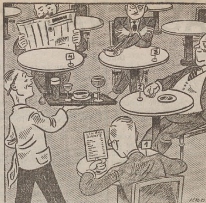
Uganite, kateremu izmed gospodov v kavarni je veseli natakark pri- nesel kavo, kateremu pivu, kateremu liker in kateremu vino!