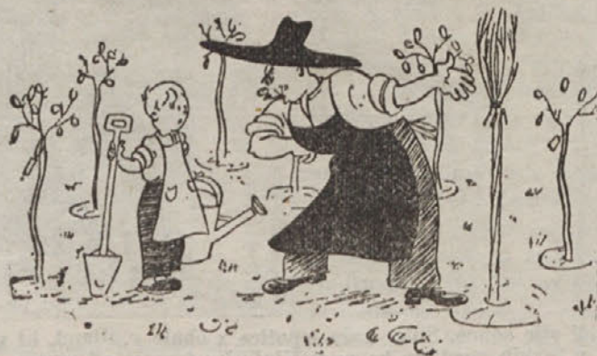
Vrtnarski mojster, ki je vcepil svojemu učenčku prevelik čut za delo in pridnost: Smrkavec, zdaj bi pa rad vedel, kaj ti meša glavo! Že drugič si vsadil to staro metlo!