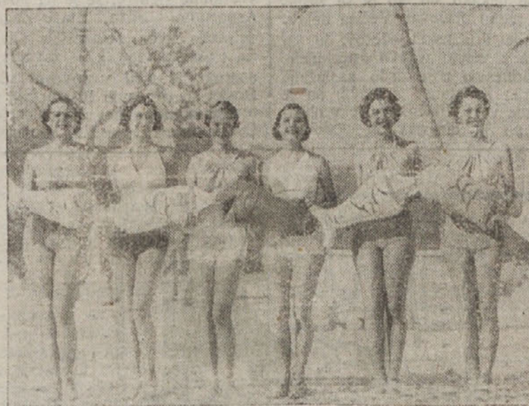
V Floridi sije sonce. Slika kaže lepotice z obale v Miami, ki uživajo v žarkih, medtem ko se v Njujorku tresejo od mraza

cej časa. Razgovarjala sta se o vseh evropskih vprašanjih, posebno pa se je Drummond dokotknil točke glede bombardiranja angleškega Rdečega križa od italijanskih letalcev v Vzhodni Afriki. Istočasno je zvedel dopisnik, da italijanski politični krogi zanikujejo vest, po ka-