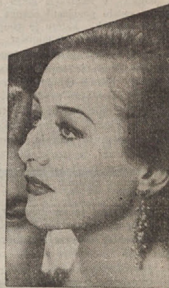
Joan Crawford, ki igra glavno vlogo v filmu ljubezni, strasti in pustolovščin »V zlatih okovih«. Oglete si ga v ljubljanskem Elitnem kinu Maticil

teri je baje abesinski cesar Haile Selasije predlagal, da bi se vršila pogajanja za sklenitev miru v Vzhodni Afriki.