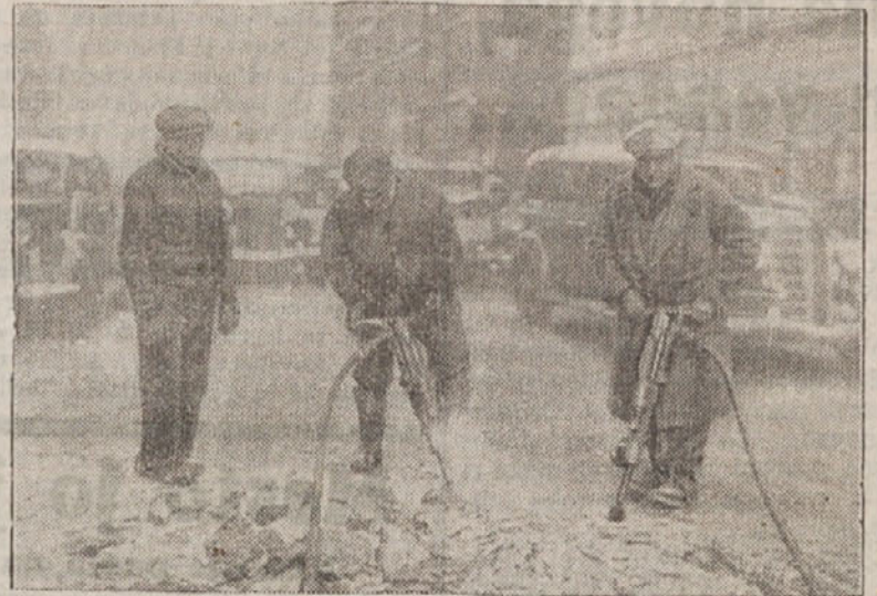
V Njujorku je pred dnevi pritisnil silen mraz. Po ulicah je bilo toliko ledu, da so ga morali razbijati s kladivi na pritisk, da ni zastal ves promet