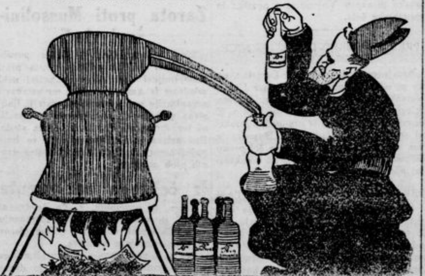
V škofovih zavodih v St. Vidu nad Ljubljano pretuhavajo letos in vsako leto bogati pridelek sadja v slivovko in druge vrste žganja.