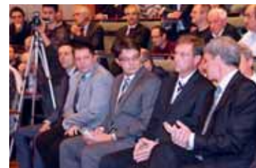
Predsednik Uprave Taluma na otvoritvi pilotskega objekta