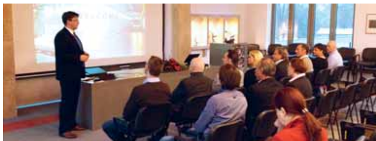
Udeleženci konference na obisku v Talumu

Povratne informacije s trga bodo ključne za prodor na trg, stalno zagotavljanje kakovosti ter nadaljnji razvoj in nadgradnjo proizvodne linije sedežnega kompleta. Seznanitev predstavnikov s stanjem pri industrializaciji, testiranjih in pridobivanju ustreznih certifikatov je bilo na konferenci naslednje pomembno poglavje. Predstavljena je bila nova kolekcija sedežnega kompleta, ki naj bi bila prvič predstavljena konec februarja prihodnje leto. Srečanje je potekalo v prijetnem druženju in spoznavanju, kar je pomembno izhodišče za dolgoročno sodelovanje pri obstoječih in novih programih. □