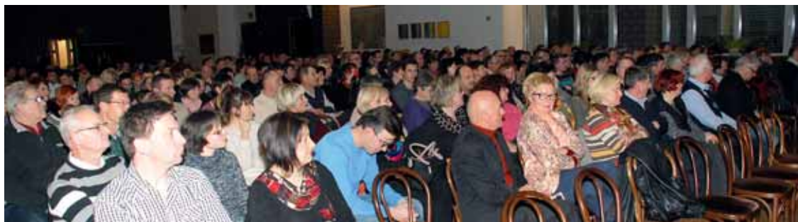
Monokomedija »Mali priročnik biznisa«