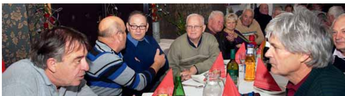
Srečanje z upokojenimi sodelavci

V sredo, dva dni pred tovarniškim praznikom, smo v restavracijo Pan v Kidričevo povabili naše poslovne partnerje. Večer sta popestrila vokalna skupina Vox Arsana in Big Band RTV Slovenija. Srečanje se je zaključilo ob prijetnem druženju. Goste smo obdarili s »Šumarji.«