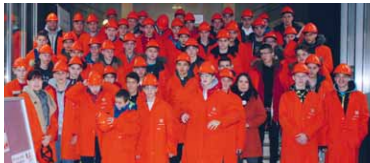
Podmladek NK Aluminij