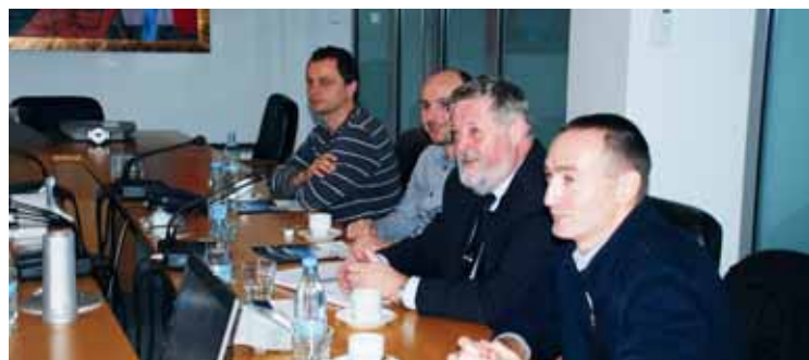
Gostje iz ELES-a