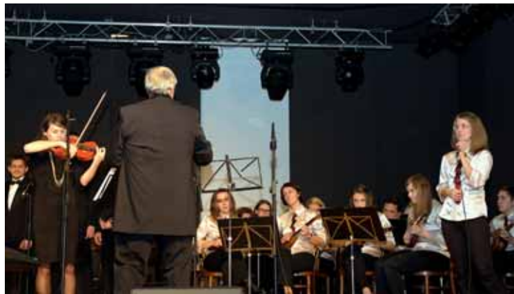
Moški pevski zbor Talum z gosti