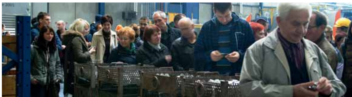
Dan odprtih vrat