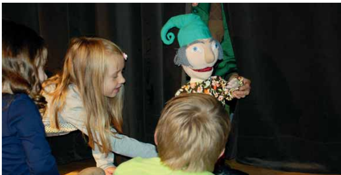
Lutkovna predstava »Vedno te ima nekdo rad«