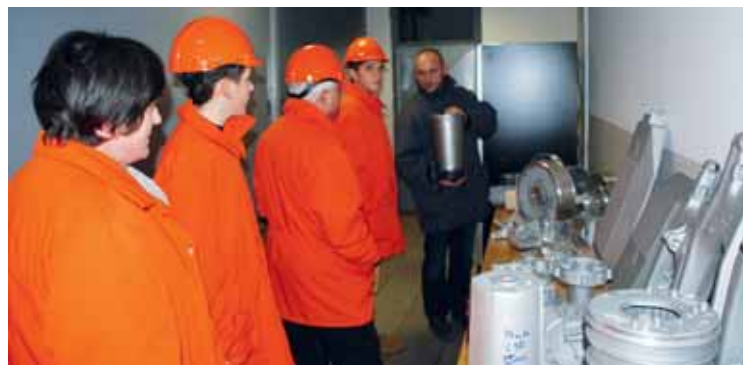
Obiskovalci dneva odprtih vrat slovenskega gospodarstva za mladino in starše

nizatorji želeli narediti korak naprej na področju poklicnega informiranja mladine na prehodu v srednje šole in tako mnogim mladostnikom in njihovim staršem pomagati pri odločitvi, kam naprej. Udeležencem smo predstavili naše poklicne potrebe ter pokazali, katero delo lahko s pridobljeno izobrazbo opravljajo v družbi Talum Ulitki. V Talumu sicer podoben dogodek, ki smo ga poimenovali Praktičen prikaz poklicev, organiziramo že več let, naslednji bo ponovno konec januarja 2015. Zagotovo smo na ta način že marsikomu pomagali pri odločitvi o njegovi nadaljnji izobraževalni poti. Prav gotovo je tudi zato letos na razpis za dodelitev kadrovske štipendije za pridobitev srednjega poklicnega izobraževanja prispelo več prošenj, kot je bilo razpisanih in kasneje podeljenih štipendij. □