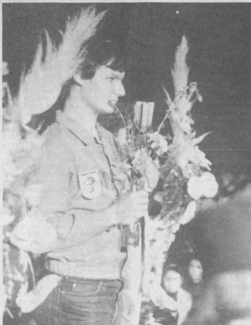
Štafeta mladosti '82

Nekaj cvetov se bo razgrnilo pred vami na straneh umetniške priloge. Nekateri vam bodo dišali omamno, drugi bolj trpko. Presodite, pa pomislite — kako sveti moj cvet!