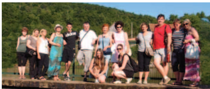
Z obiska Like in Zadra.