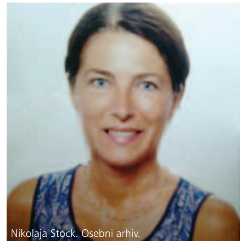
Nikolaja Stock. Osebni arhiv.