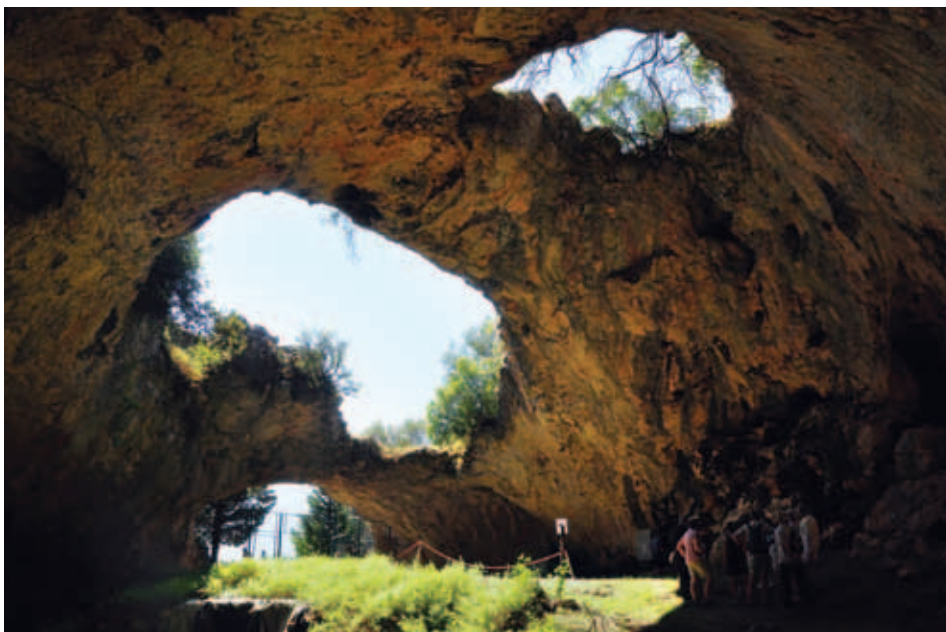
Vela špilja pri Veli luki na Korčuli. Foto: Darko Mohar

Od večjih jadranskih otokov sta planincem Bazovice ostala za obisk samo še Hvar in Šolta. Prihodnje leto! | Darko Mohar