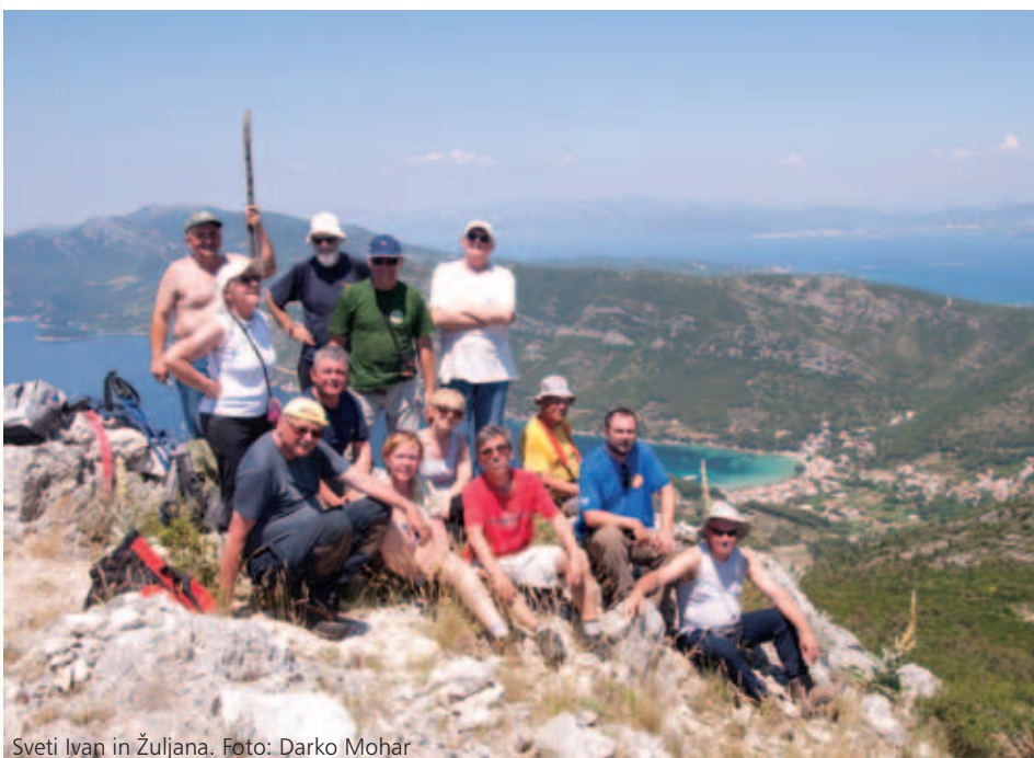
Sveti Ivan in Žuljana.