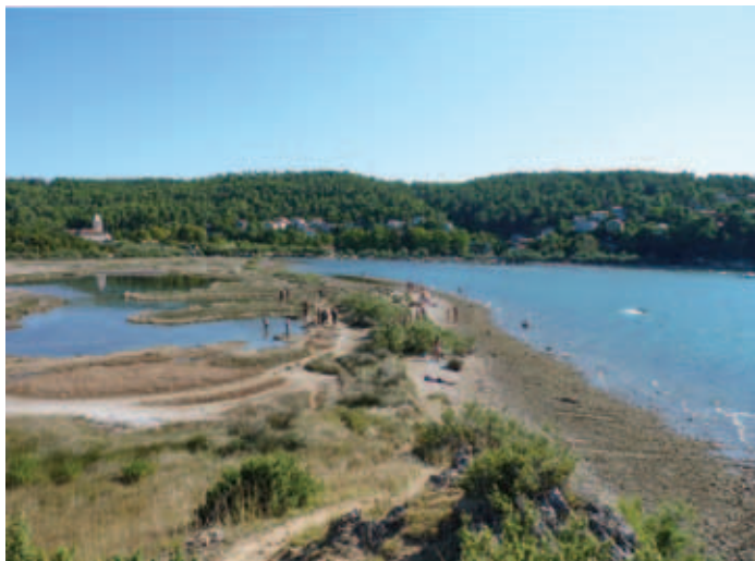
Karinsko morje.