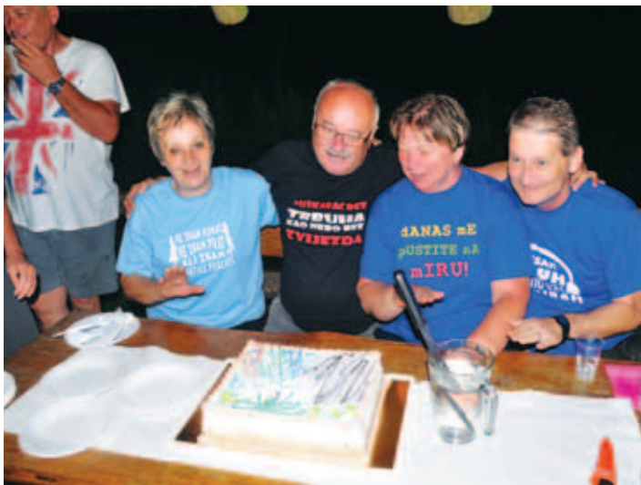
Slavljenji in torta.

gor peljejo zelo prašne, petnajst kilometrov dolge bele ceste, je bil užitek v prekrasnem razgledu na Kamniške Alpe neizmeren. Za sprehajanje po planini je bilo žal premalo časa, tako da se bo treba kljub cestam nekega dne še vrniti sem. | Darko Mohar