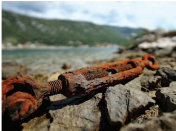
Le kos zarjavega železa.