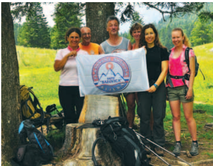
Z novimi prijatelji na planini Dol pod Konjem.