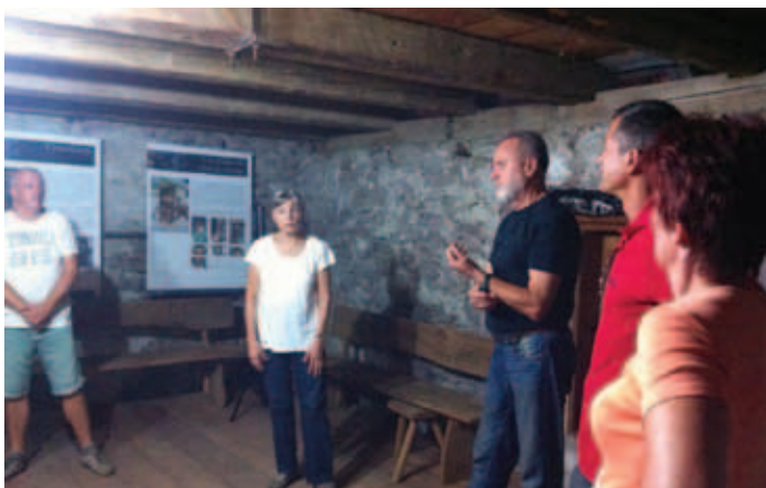
S plesne delavnice.