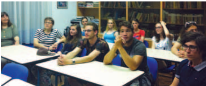
Zanimanje za zamejstvo.