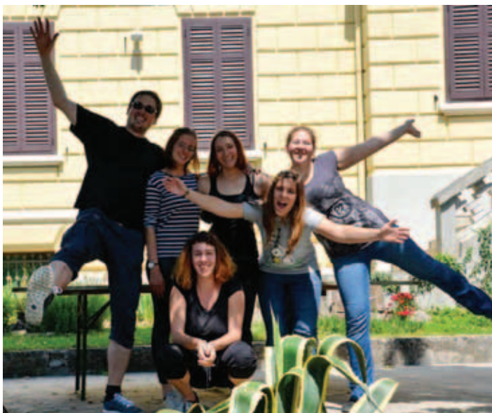
Veselje in mladost.

V odmoru med igrami so se tekmovalci okrepčali s sendviči in sokovi ter si ob vsesplošnem navdušenju za posledek privoščili še jagode. Najuspešnejše so pričakale različne sladke nagrade, ki jih bodo spominjale na turnir. Tisti nekoliko manj uspešni pa bodo turnir, ne glede na osvo-