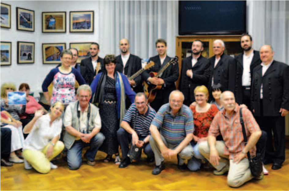
Nastopajoči in sodelujoči.