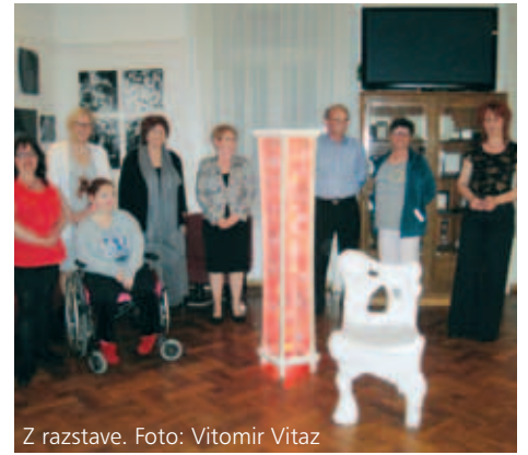
Z razstave.