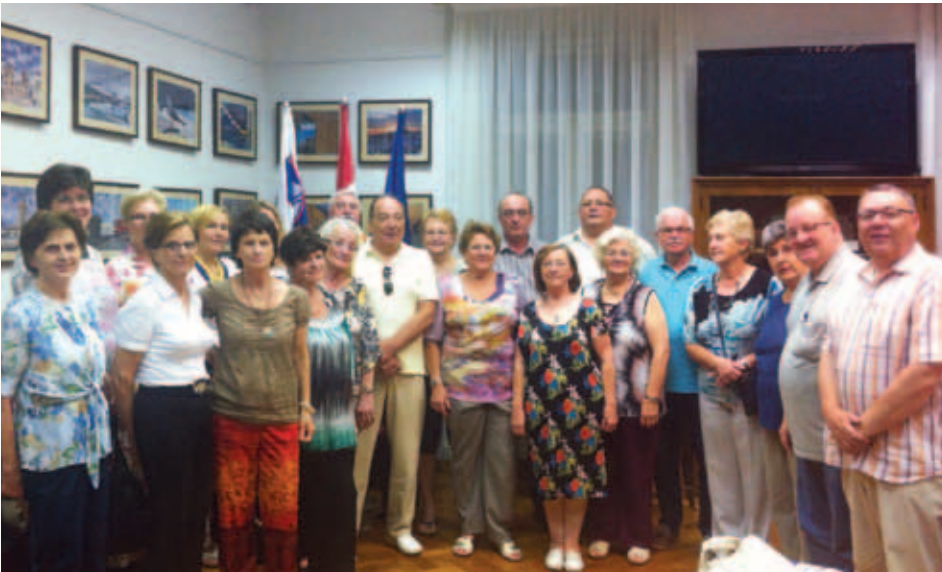
Člani sveta SNM PGŽ.