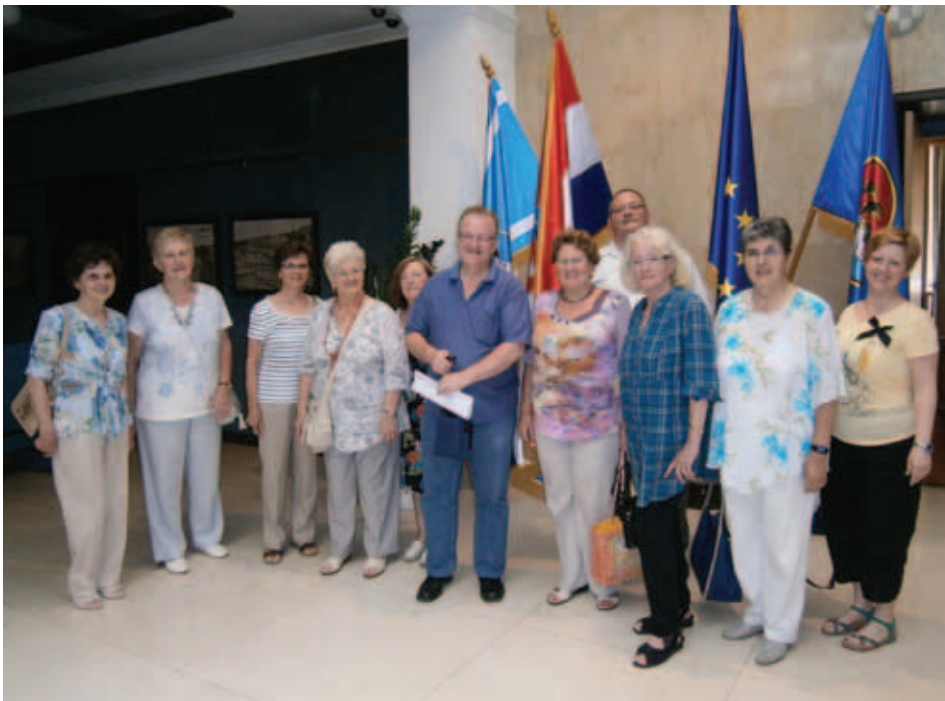
Člani sveta na mestni ravni.