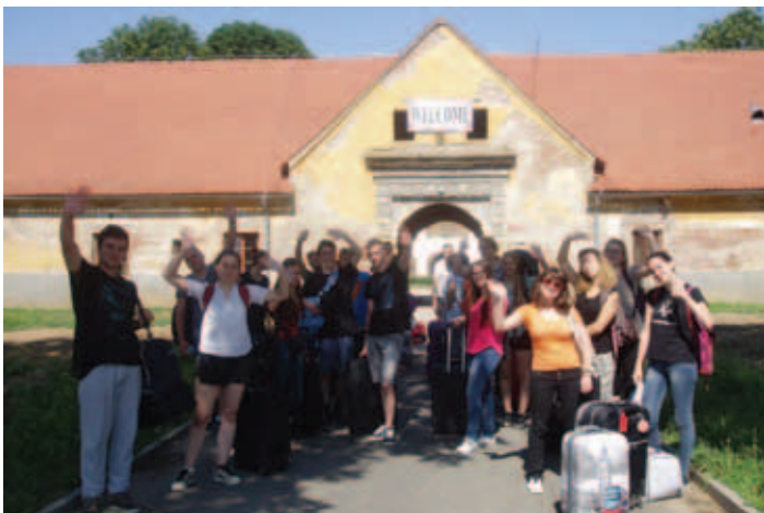
Spomin na srečanje.