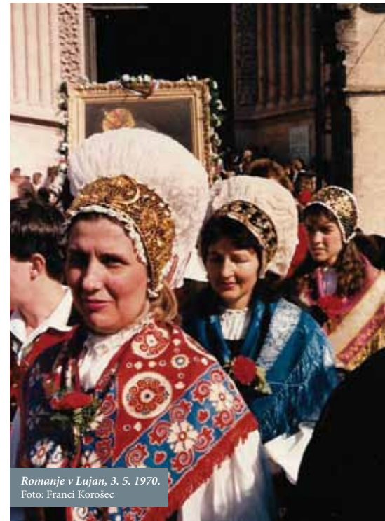
Romanje v Lujan, 3. 5. 1970.