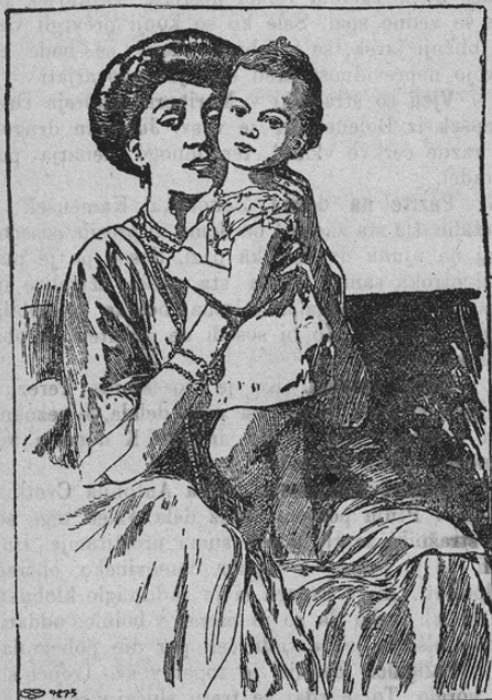
Fürstin Elisabeth Windischgrätz mit ihrem Töchterchen Stephanie

Naša slika kaže kneginjo Windischgrätz, ki spada gotovo med najbolj priljubljene člane cesarske družine. Cesar je njen stari oče, kajti ta kneginja je edina hčerka tako rano umrlega prestolonaslednika Rudolfa. Kneginja