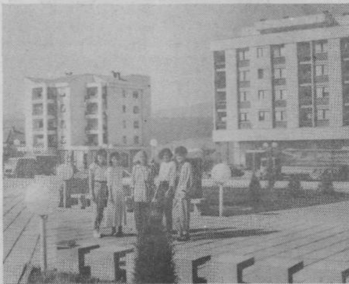
Novi mestni trg v Bileči