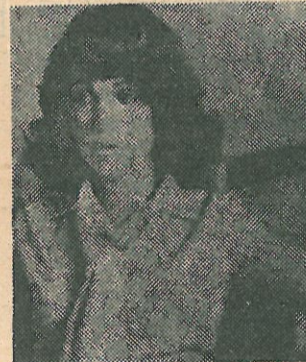
Judith Resnik delala v razvojnem oddelku držbe Herox v Kaliforniji.

Pred vključitvijo v Nasin vesoljski center je