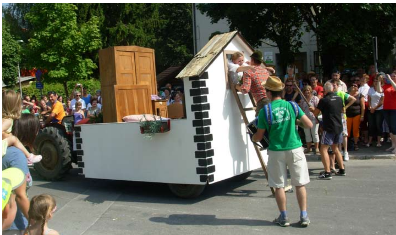
Vasovanje spravilo v smeh številne obiskovalce

Kmečki praznik je bil letos nekaj posebnega. Po petih letih je bila spet na vrsti povorka starih kmečkih običajev. Priprave so se pričele že v lanskem letu in so zahtevale veliko sodelovanja z drugimi društvi, vaškimi skupnostmi in posamezniki iz bližnje in daljne okolice. Na srečo so se le ti množično odzvali in se vsak po svoje začeli pripravljati. Tako je letos