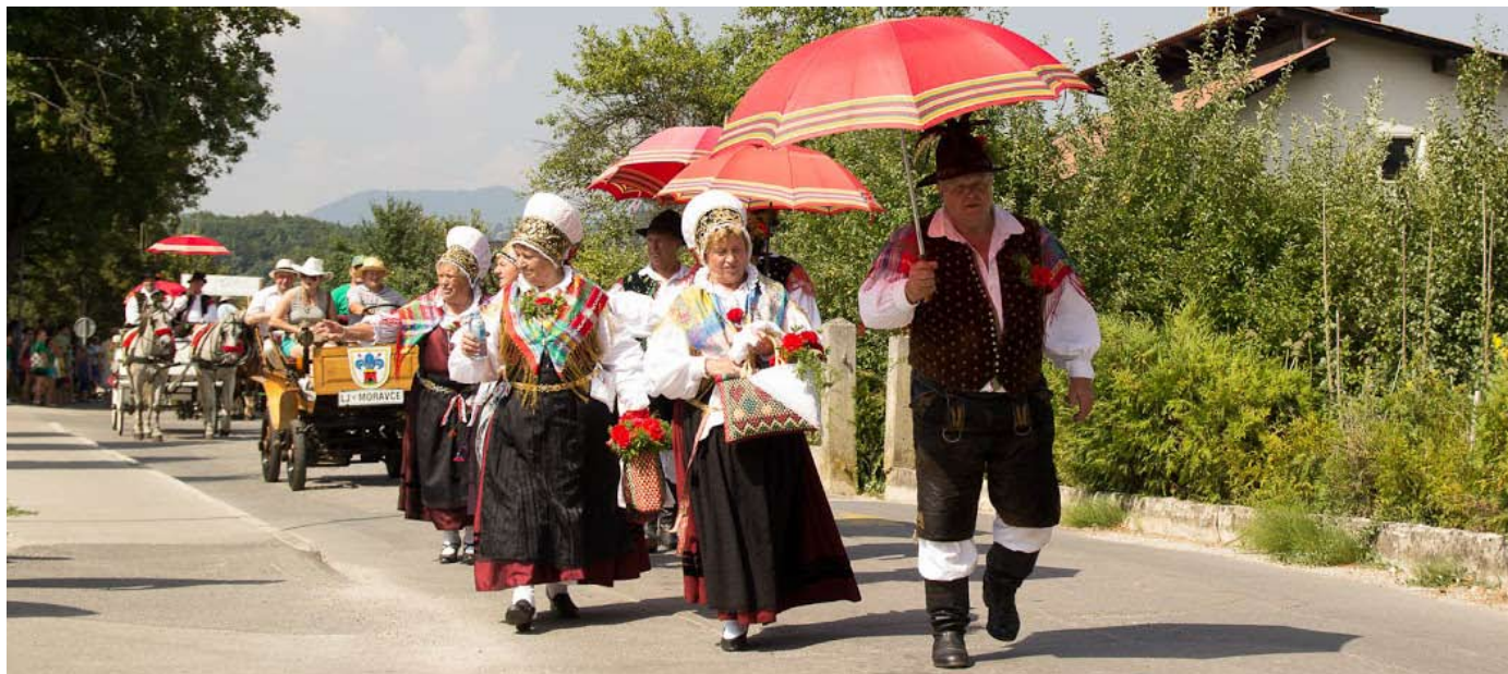
Takoj za narodnimi nošami se peljeta predstavnika organizatorjev s podžupanom

Društvo podeželske mladine Moravče se je letos še posebej izkazalo. Poleg že tradicionalnega kmečkega praznika zadnje nedelje v juliju, so se lotili še čisto novega projekta in petek pred tem uspešno izpeljali 1. Moravško noč, ki je več kot odlično uspela. K temu je precej pripomogel tudi na pol moravški Ansambel Zajc, ki vedno bolj navdušuje staro in mlado.