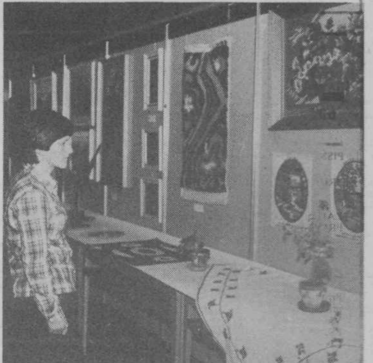
Bolniki iz psihiatrične bolnišnice v Polju so razstavili razna ročna dela, katerih izdelovanje sodi k njihovi delovni terapiji