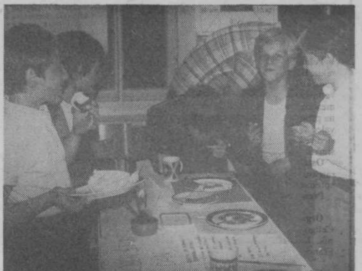
Hm, je dobro! Gospodinski krožek OŠ Edvarda Kardelja se je predstavil na šolski prireditvi s koristnim in prijetnim

Po kulturnem programu so bila zaslužnim krajanom za njih uspešno delo podeljena priznanja krajevnih skupnosti, aktivnim družbenopolitičnim delavcem pa za njihovo dolgoletno delovanje priznanja Osobodilne fronte.