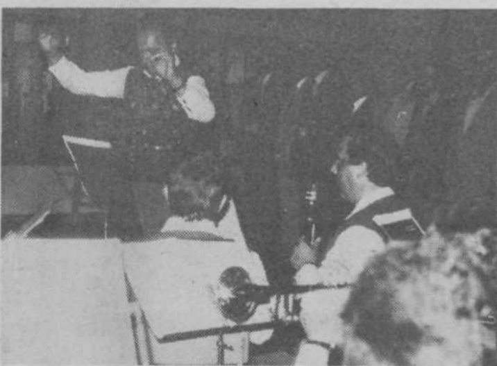
Papirniški pihalni orkester Vevče je na začetku prireditve zaigral Internacionalo