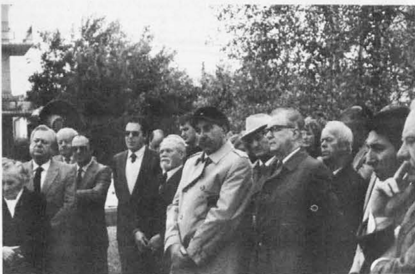
Del prisotnih na osrednji svečanosti v Čedadu

stinko, nas je župan povabil na kozarec vina.