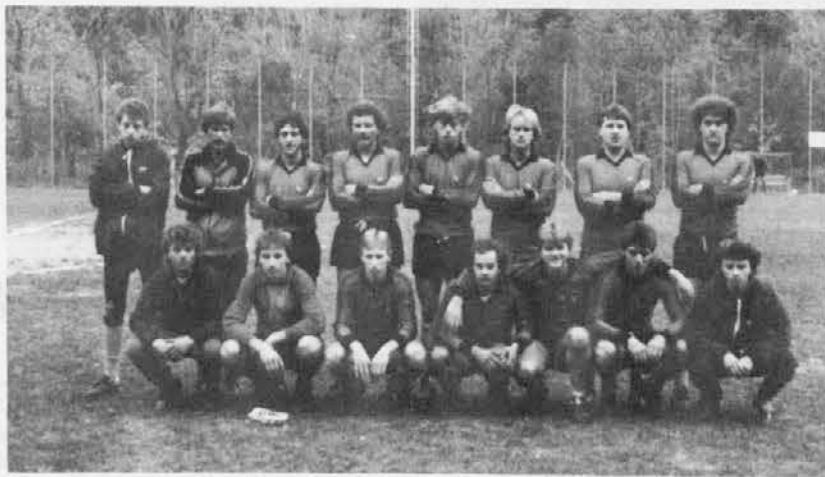
La formazione della A.S. Pulfero 1985-86

4 RETI: Under 18 Valnatisone 5 RETI: A.S. Savognese 6 RETI: A.S. Pulfero, G.S.L. Audace 7 RETI: Giovanissimi Valnatisone 8 RETI: U.S. Valnatisone 14 RETI: Esordienti Audace 18 RETI: Esordienti Valnatisone