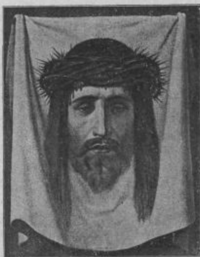
Szv. Veronike robeč.

Baronius Caesar je szledkar zbetezsao; od dnéva do dnéva njemi je vszigidár hūse bilo, csi li szo vracsitelje