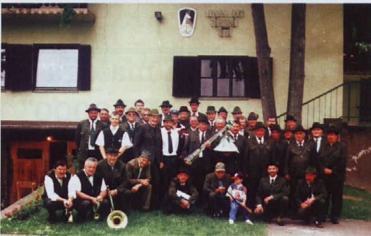
Po slavnostnem podpisu etičnega kodeksa