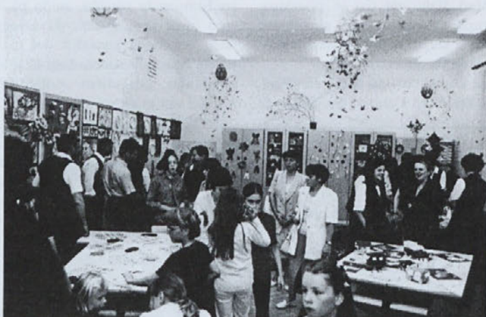
Utrinek z razstave učencev ob dnevu šole

Pobude in predlogi so bili sprejeti v dobro učencev. Svet Občine Juršinci je ponovno dokazal, da se zelo zaveda pomembnosti javnega zavoda, katerega osnovni cilj je vzgojiti dobrega občana. Posebno zahvalo je treba izreči g. županu, ki si neizmerno prizadeva ohraniti nadstandard učencev, hkrati pa na državnem nivoju išče ustrezne poti za pridobivanje soglasij in sredstev za pričetek gradnje večnamenske športne dvorane in