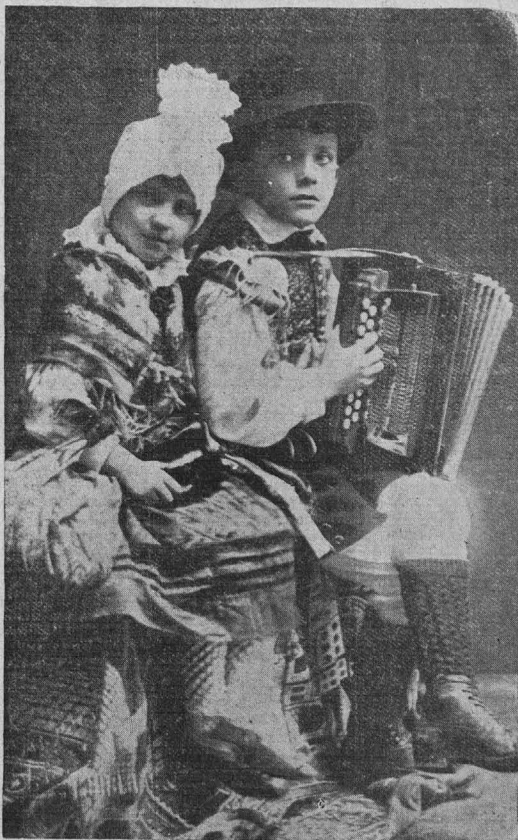
Otroci v gorenjski noši

IZURJEN MESAR dobi dobro službo v Euclidu.