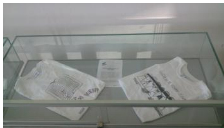
Izdelki ustvarjalnega natečaja Povej z majico

Otvoritev razstave na šoli je potekala ob občinskem prazniku in v ta namen organizirani osrednji proslavi, kjer so si razstavljene izdelke lahko ogledali predstavniki občine, vabljeni gostje ter občani.