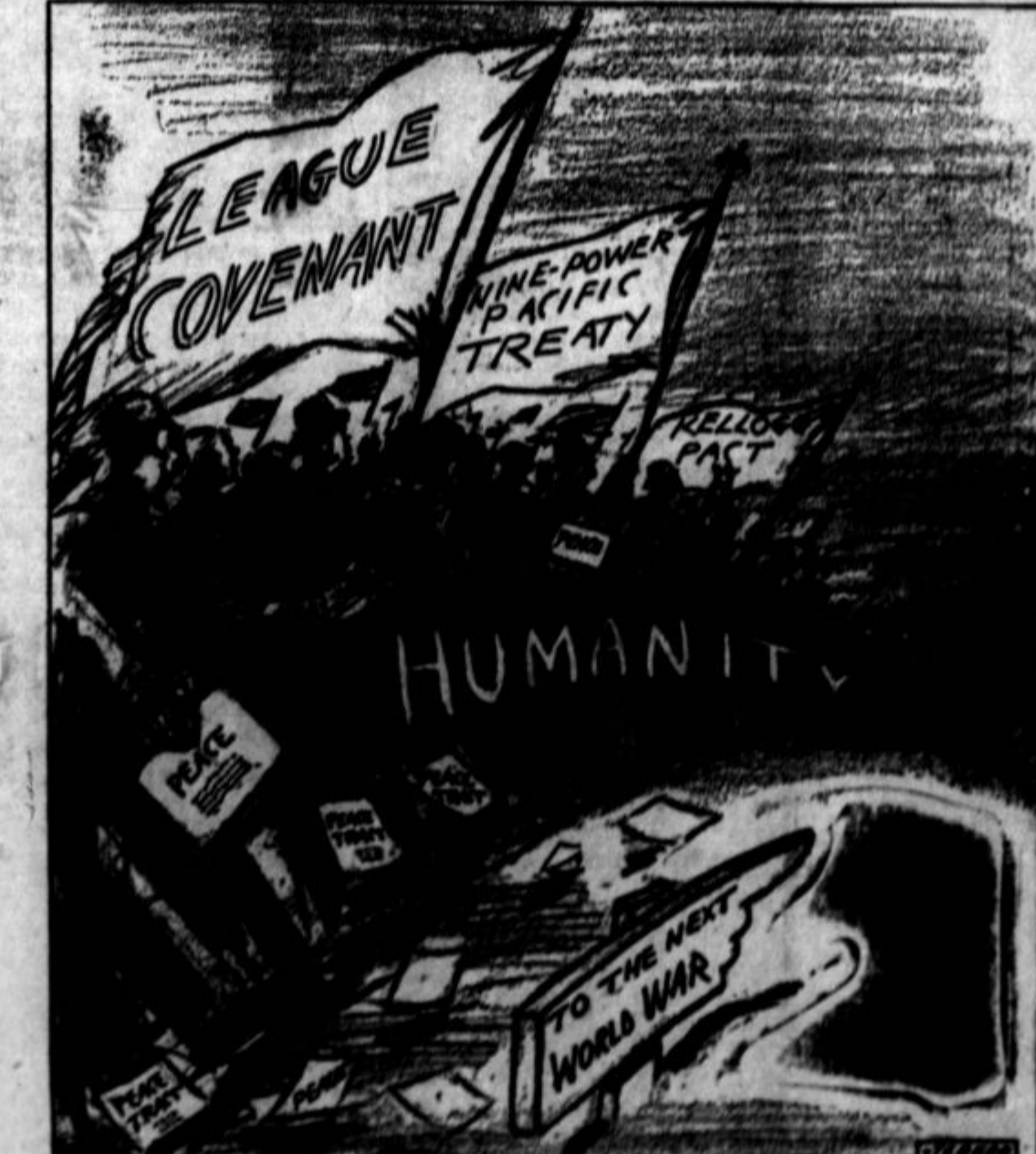
Mirovne zaslave na pohodu nove vojne . . . (Narisal Jerger.)

Monteagle, Tenn. — V gozdovih Tennessee Products kompanije je bila oklicana stavka, ker je družba ignorirala odredbo Nire administracije, da je plača 85 centov od klafre drv prenzika oziroma, da je družba kršila pravilnik. Drvarji so člani Cumberland Mountain Workers lige, ki vodi stavko.