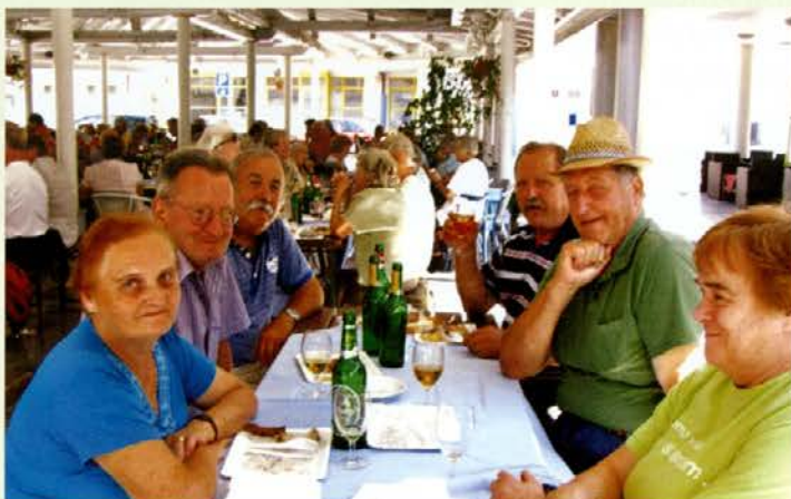
Na pikniku, avgusta 2012, je bilo prisotnih 192 članov.