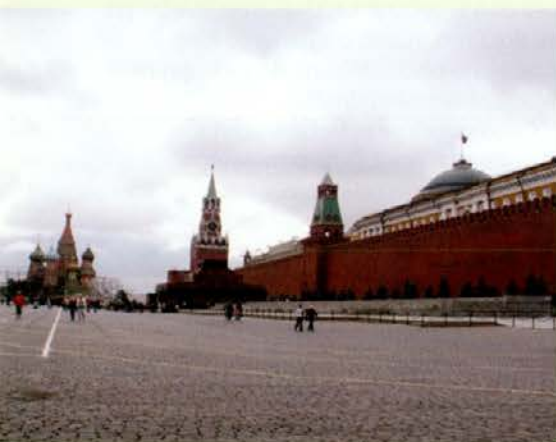
Moskva – rdeči trg s Kremljem in Vasiljevskim saborom v ozadju

pomeni, da imajo uzakonjeno dvojezičje in poleg ruščine lahko povsod uporabljajo svoj nacionalni jezik (ki izvira iz turške skupine jezikov). Takšnih republik je v Rusiji še 20! Avtohtoni prebivalci (ti predstavljajo približno polovico vsega prebivalstva) se po videzu zaradi nekoliko azijskih potez, predvsem pa po govoru, takoj ločijo od Rusov oz. od ostalih prebivalcev. Šele tukaj, kjer sva dober teden nastanjena na istem mestu, se prične najin dopust v bolj tradicionalnem smislu besede. Kopanje v Volgi, vožnja z ladjico, druženje, počitek ... Vendar tudi to mine kot bi mignil, in po nekaj večerih udobnih »matrasov« že sediva na nočnem avtobusu za Moskvo. V vrvež ruske prestolnice prispeva navsezgodaj zjutraj, okoli pete ure. Ko odloživa prtljago, je pred nama maratonski sprehajalni dan. Na hitro »obdelava« centralne znamenitosti, kot je Rdeči trg z znamenitim Vasiljevskim saborom, Kremelj, Manežni trg, ker pa imava pred sabo še ves popoldan, preskusiva tudi legendarni moskovski metro (ki nima zaman svojega slovesa) in se popeljeva na ogled parkov in samostanov (Novodevičji samostan) izven centra. Proti večeru sva že tako utrujena, da komaj stojiva na nogah. Dan je bil res dolg in prav komaj že čakava, da se pozno zvečer vkrcava na vlak, ki naju bo odpeljal do ukrajinsko-madžarske meje in na katerem bova preživela naslednjih 40 ur.