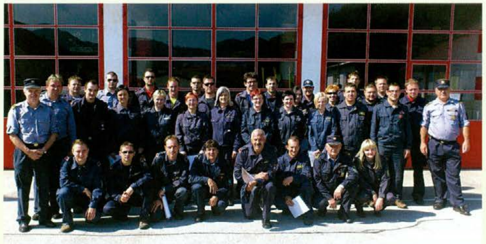
S podelitve diplom in spričeval

Za vodjo skupine je tečaj uspešno končalo 49 kandidatov, za izprašanega gasilca pa kar 32 slušateljev. Oba tečaja sta potekala v učilnici za izobraževanje, ki jo je Gasilska zveza Slovenije potrdila v osrednji enoti Prostovoljnega gasilskega društva Slovenj Gradec v Mestni občini Slovenj Gradec, ki razpolaga tudi z