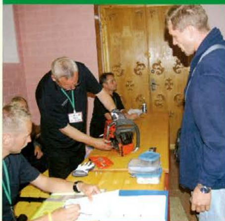
Pregled motornih žag