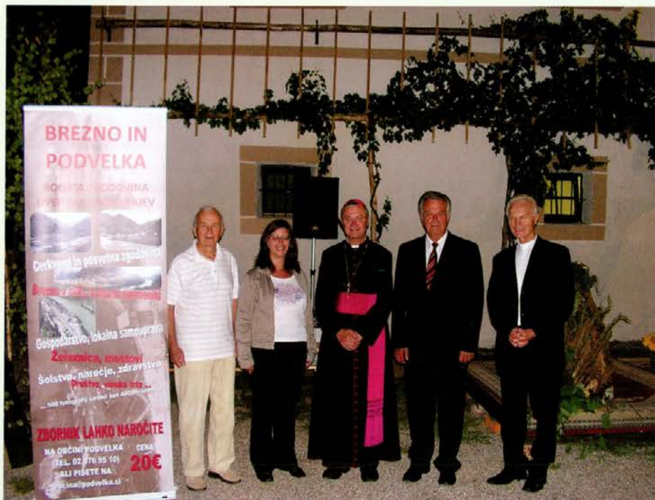
Bogata zgodovina dveh krajev