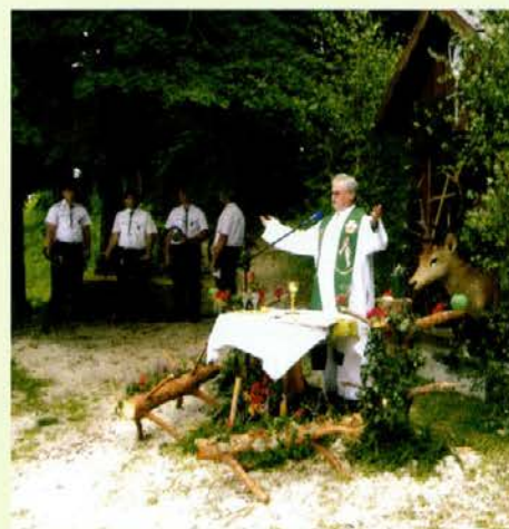
Lovska maša pred Lovskim domom Podgorje

povedal ob koncu maše, mu bodo podgorski lovci radi razložili. Šlo je za poučno basen, ki govori o pravih prijateljih. Lovci svojega prijatelja tudi v nesreči ne zapustijo. Taka srečanja ob lovski koči na Čerčejevem vrhu nam govorijo prav o tem, da moramo biti dobri prijatelji.