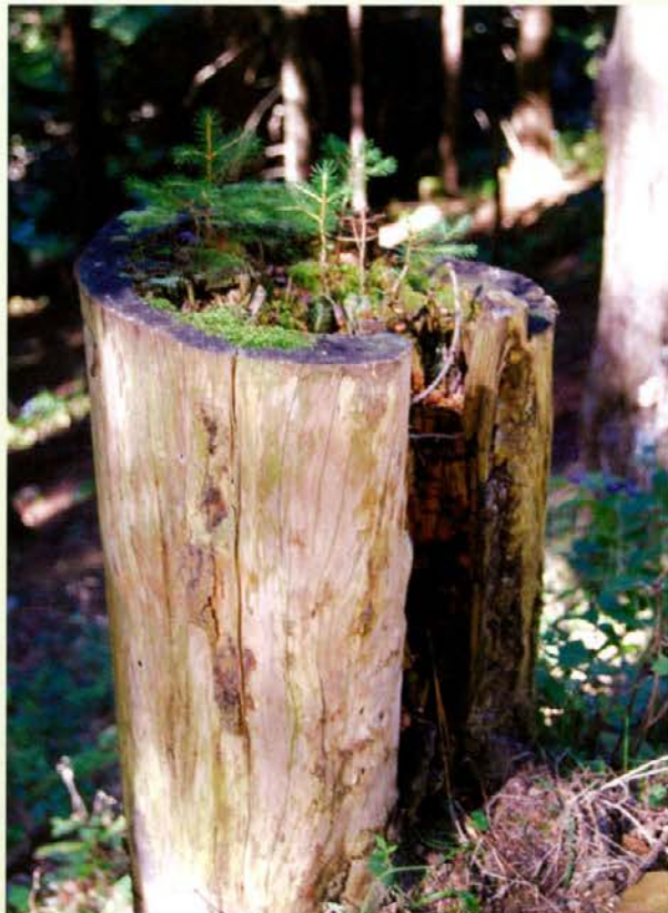
Rastišče na štoru ustreza mladim smrečicam.