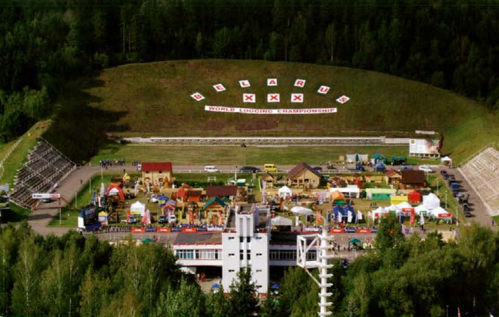
Prizorišče tekmovanja