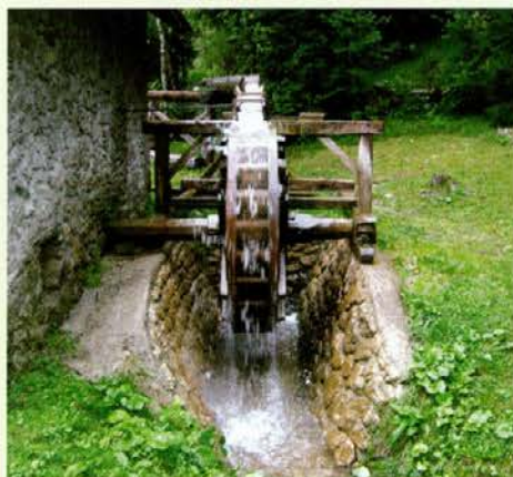
Plešivški mlin

Kljub temu smo se pod dežniki odpravili na pot po soteski Kaštel do mlina, kjer sta