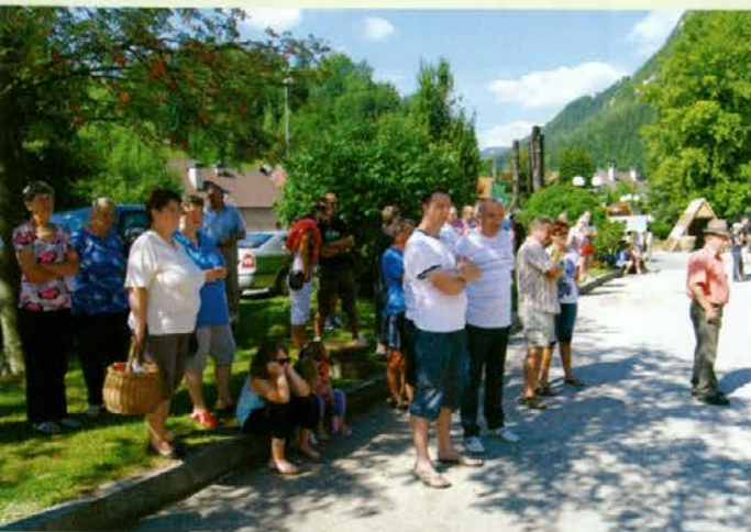
Obiskovalci so občudovali spretno gozdarje in gozdarke.