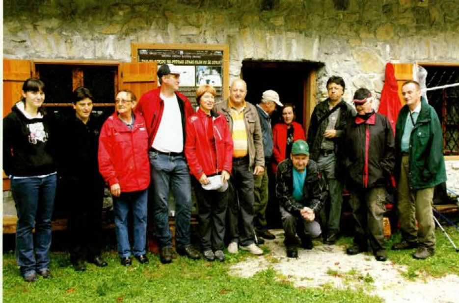
Pohodniki po GUP