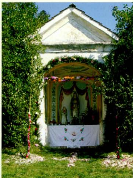
Lepo okrašena kapelica na lepo nedeljo sv. Roka

začel streči bolnikom. Ko je končno le prišel v Rim, je tam stregel kužnim bolnikom in jih veliko čudežno ozdravil. Nazaj grede se je v Piacenzi sam nalezel kuge. Da bi v bolnišnici ne bil nikomur v nadlego, se je zavlekel v zapuščeno kolibo. Tjakaj mu je nosil kruh pes iz sosednjega gradu. Graščak je opazil, kako je vzel pes z mize kruh in izginil z njim. Nekoč je stopil za živaljo in našel Roka v razpadli koči v velikem trpljenju in zapuščenosti. Vzel ga je k sebi in zanj skrbel. Ko je Bog Roku vrnil zdravje, se je romar napotil domov.