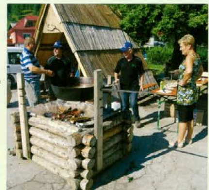
Priprava tradicionalne jedi frike