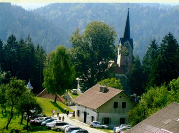
S pločevino obkrožena cerkev sv. Roka in farovž na praznični dan, ko Sele obišejo romarji od blizu in daleč.

Z medsebojnimi srečanji na Rokovo si kljub primežu vsakdanjega vrveža in sodobni tehnologiji, ki nas duši, vedno znova dokazujemo, da ljudje nismo roboti. Ob tej priložnosti se ljudje družimo in tako delimo skrb in težave, ki nas pestijo. Še bolj pa nas razveseli iskrena tolažba ali spodbuda sočloveka, ki je največje zdravilo za našo dušo. Potrebna sta le pristni stisk roke in pogovor za naš duhovni mir, ki ga tukaj, pri cerkvi sv. Roka, ob tako velikem prazniku lahko vselej najdemo.