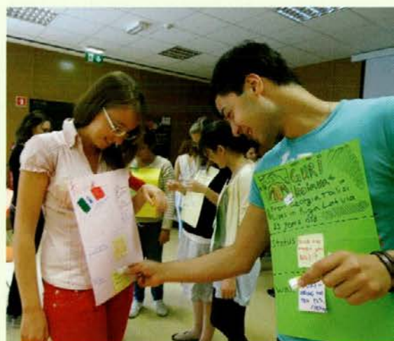
Spoznavne igre na mladinskem usposabljanju »Multipliers of volunteer management« v Slovenj Gradcu