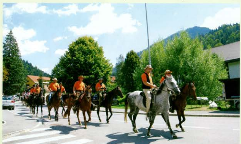
38 konjenikov Koroške konjenice je popestrilo sončno soboto v Črni.