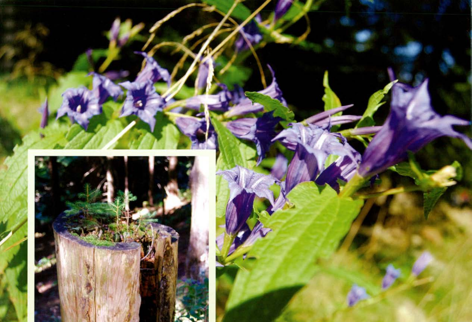
Svišč; genatiana asclepiadea ali svečnik