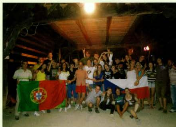
Vsi udeleženci mednarodne mladinske izmenjave z naslovom »Re-cycle your mind«