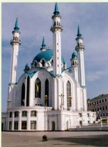
Znamenita mošeja Kol Šarif v Kremlju

mesto, v katerem sva izstopila, je prestolnica republike Tatarstan, ene redkih islamskih republik Ruske federacije. Zaradi nafte in razvite avtomobilske industrije je med najbogatejšimi ruskimi republikami. Navduši s svojo arhitekturo in urejenostjo. Največja znamenitost tukaj je gotovo Kremelj, znotraj zidov katerega najdemo tako islamsko mošejo kot pravoslavni hram. Pravzaprav je ta prepletenost islamske in ruske kulture prisotna na vsakem koraku. Opazimo pa tudi preplet starega, tradicionalnega in novega, modernega, kajti Kazan je mesto, ki se precej hitro razvija. Vendar je ta preplet precej organski in za razliko od nekaterih mest izpade prav prikupno.