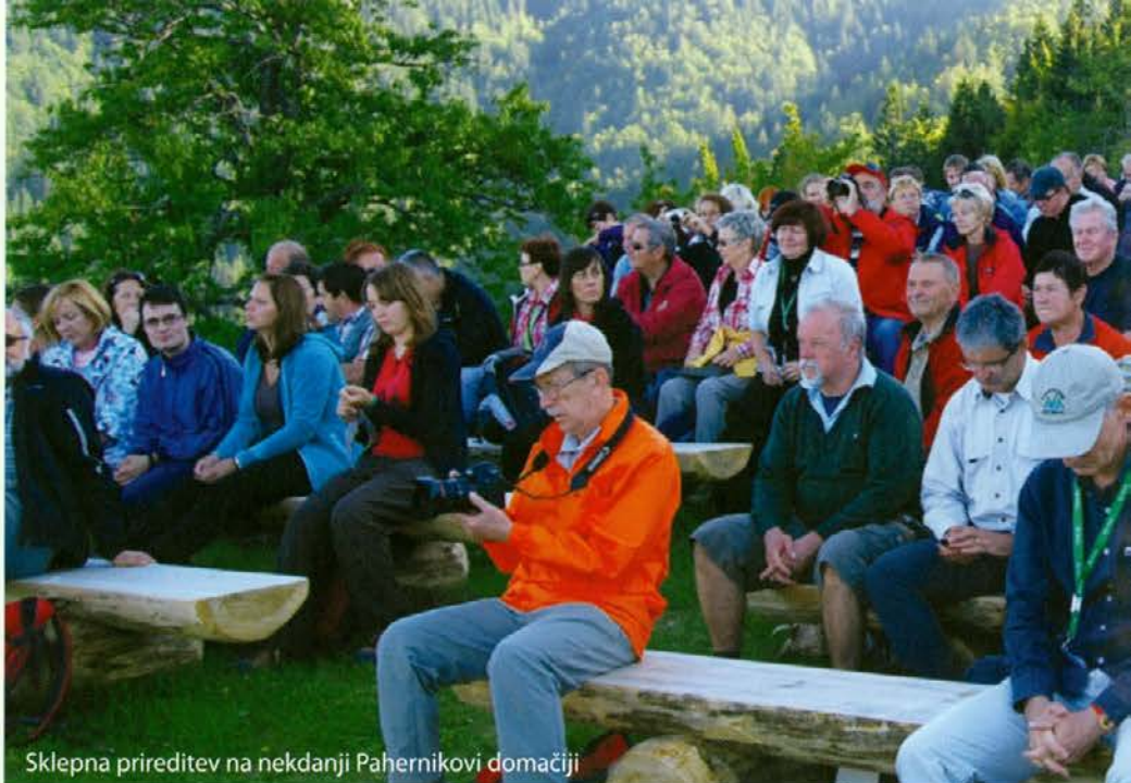
Sklepna prireditev na nekdanji Pahernikovi domačiji

Na dvorišču pred radeljskim dvorcem in novo gozdarsko poslovno stavbo in trgovino GG so za dobrodošlico poskrbele članice radeljskega društva kmečkih žena, vsečno oblečene v noše svojih prednic, z aperitivom in domačo potico in kasneje še enkrat sredi gozda z malico iz domačih pridelkov.