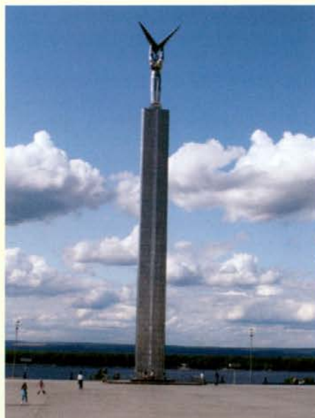
Trg Slave, v ozadju Volga

Zvečer pa po ustaljenem ritmu zopet na vlak, novemu mestu naproti. Kazan,