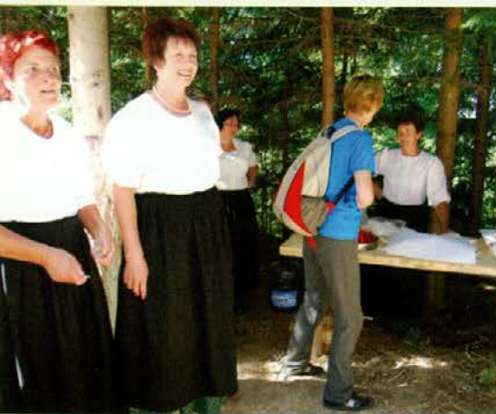
Članice Društva kmečkih žena iz Radelj