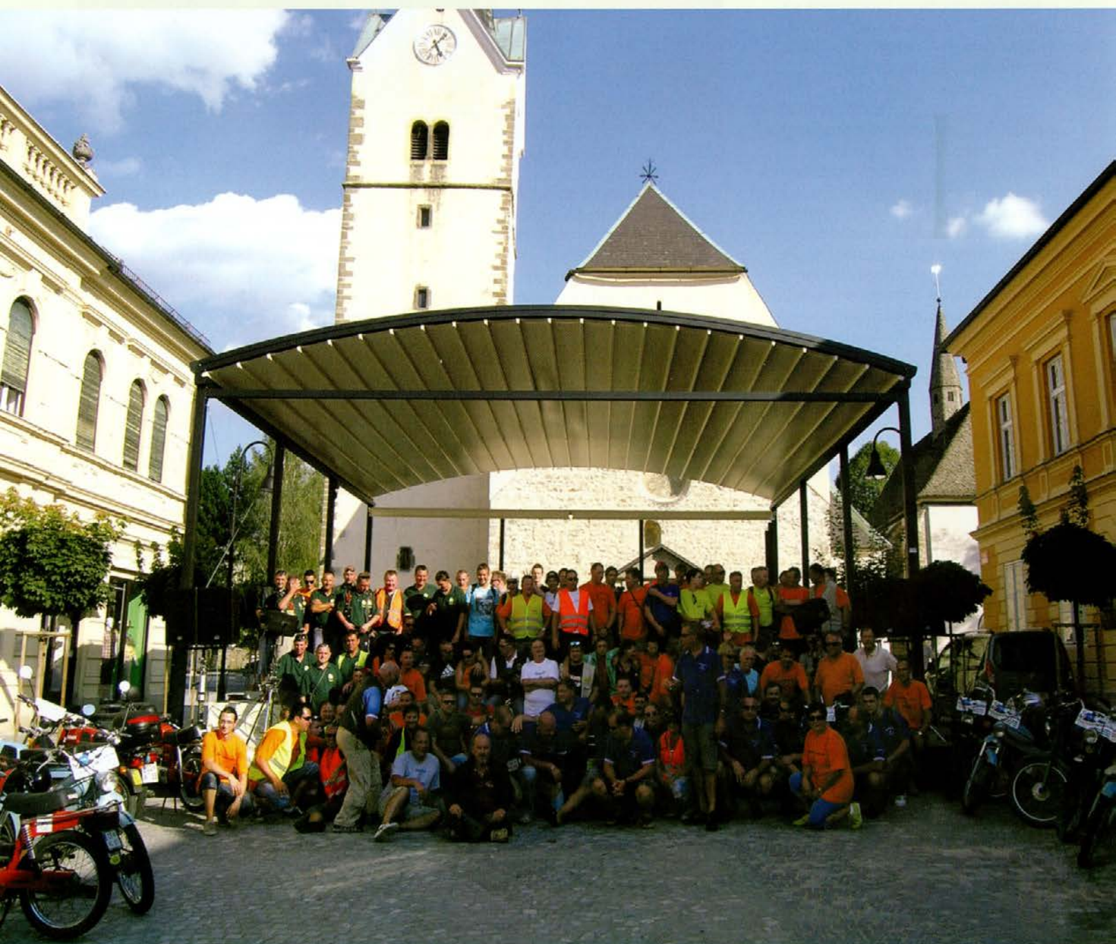
Zbralo se je 125 voznikov Tomosovih mopedov

Da je izvedba prireditve potekala brez zapletov, se v klubu posebej zahvaljujemo PGD Golavabuka in vsem donatorjem, hkrati pa za drugo leto obljublamo novo, nepozabno Tomosijado.