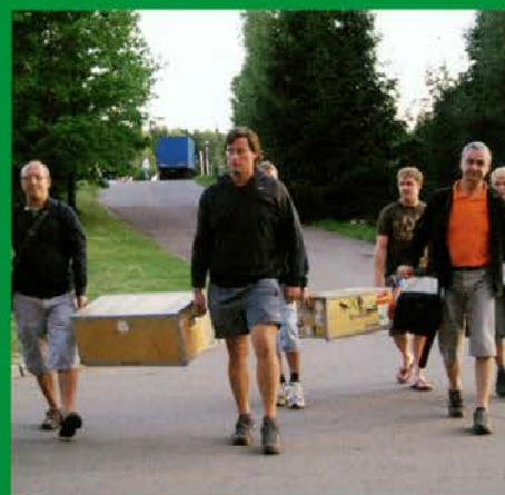
Navijači so po svojih močeh pomagali tekmovalcem