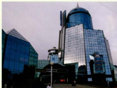
Železniška postaja – ponos Samare

Vožnja do najine naslednje postaje – Samare – ni bila najbolj udobna, saj so »udobne« karte že zdavnaj pošle. Zato pa naju je presenetila nova železniška postaja v tem milijonskem mestu. Steklena stavba, visoka 100 metrov (bila naj bi najvišja železniška postaja na svetu), z razgledno ploščadjo na vrhu, je bila zgrajena na začetku našega stoletja.