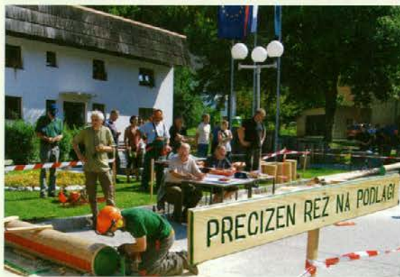
Dogajanje na poligonu