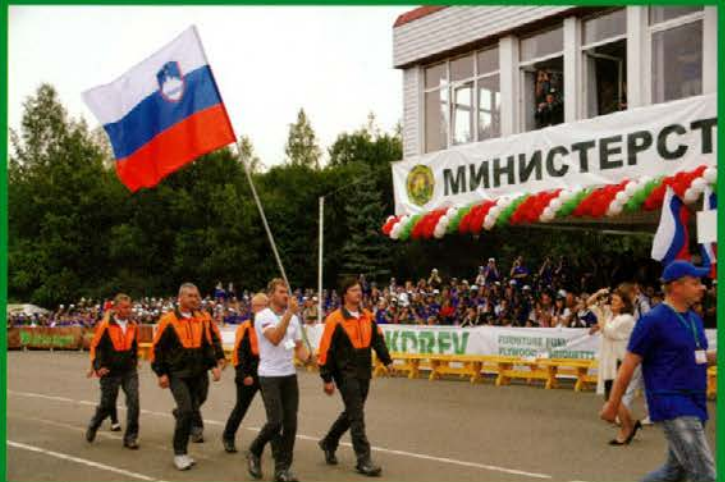
Ekipe Slovenije