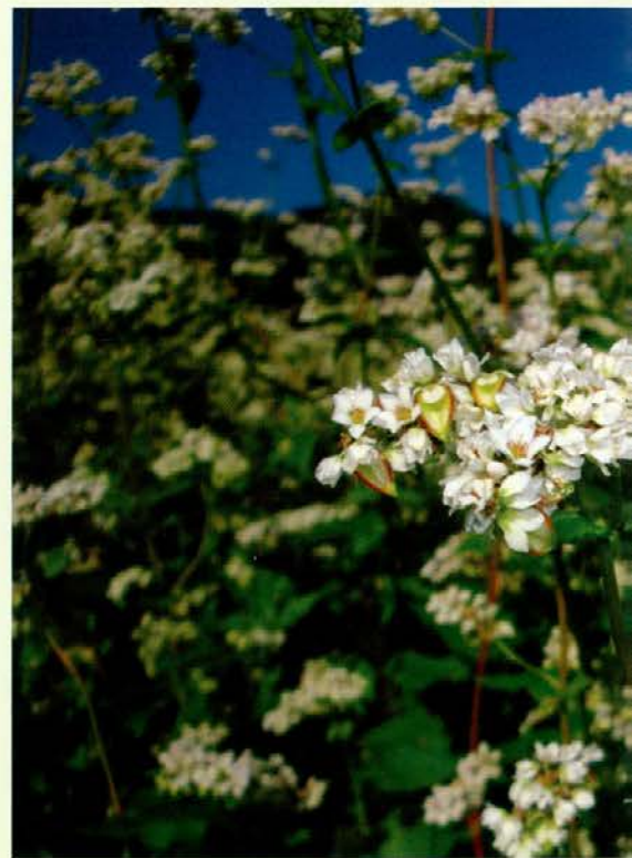
Ajda v cvetju

V moji vasi se marsikaj dogaja; res, da se mladi ne družijo več, kakor smo se mi, ampak ljudje se ukvarjajo z marsičem. Pravo veselje je pogledati dobnavsko polje v vseh letnih časih, od oranja pa do žetve in spravila strniščnih posevkov, kot je npr. ajda.