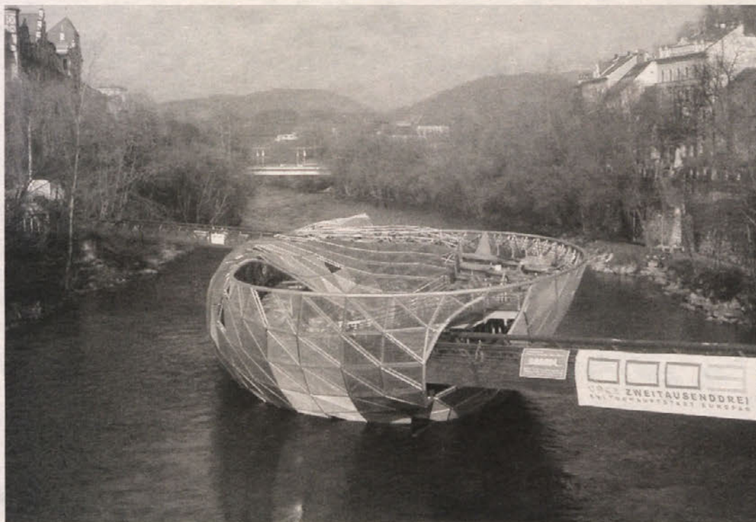
Otok na Muri