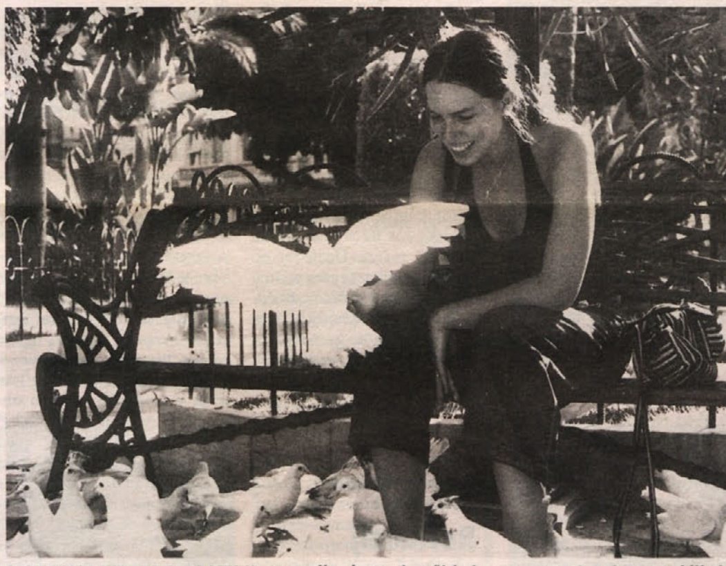
SLOVENSKE VESTNIK – praznik odprtosti, sožitja in samozavesti. Tokrat ga oblikuje mladina. Več na 3. strani.