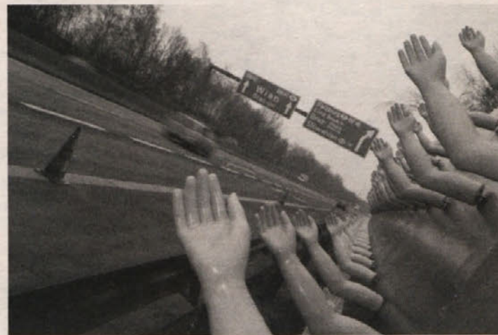
Roke na avtocesti

iz držav jugovzhodne Evrope. V Gradcu se bodo v tem letu srečali jazzovski glasbeniki iz držav Evropske unije (Anglije, Francije, Italije in Skandinavije), prihodnjih držav članic EU Poljske, Češke, Madžarske in iz balkanskih držav. Eden od vrhuncev klasične glasbe bo brez dvoma ruska glasba 18., 19. in