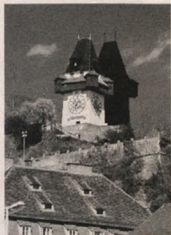
Senca za stolpom

snovalcem uspelo Muro bolj vključiti v ta del mesta, saj je prej veljala le za »hitro in nedostopno vodo«. Samo nekaj korakov od otoka nastaja Hiša umetnosti/Kunsthaus. V Gradcu jo že vsi poznajo, saj je biformna oblika, ki ji manjka še modra prozorna lupina, skoraj dokončana. Hiša umetnosti,