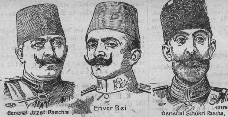
Leitende türkische Militärs.

Izzet-paša in general Şukri-paša. Prinašamo slike teh odličnih vojakov.