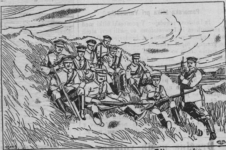
Eine Abteilung der Tsingtauer Bürgerwehr

Mogočna nemška kolonija ob kitajski meji je padla pred velikansko premočjo japonskih izdajalcev. Junaško se je držala nemška posadka in se dva meseca branila proti več kot stokratni premoči Japoncev in Angležev. Za brambo v mestu ustanovili so Nemci neko „Bürgerwehr“, v katero je vstopilo vso moško prebivalstvo, ki ni bilo pri vojaki. Prinašamo danes sliko te meščanske brambe.