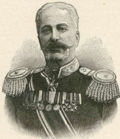
Ruski general Čičagov.

Naše slike nam kažejo razne prizore z bojišča. Na str. 635. vidimo, kako Japonci izkazujejo zadnjo čast padlim ruskim častnikom. Dva vojaška duhovnika v obredni obleki opravljata pogrebne molitve. Pogreb torej tudi pri Japoncih ni le „civilen“. Častnik, ki se sklanja k tлом, prižiga kadilo. Tudi vence so položili na rakev. Tako so pokopavali Japonci častnike pač le po manjših bojih. Po velikih bitkah je obležalo na tisoče mrličev dalj časa nepokopanih.