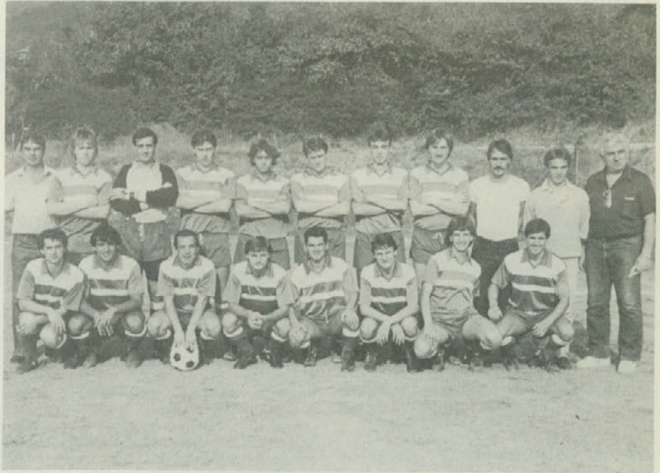
Ekípa 3. amaterske lige ŠD «Breg».

Pari naslednjega kola (nedelja 13. aprila): Vesna - Zarja; Breg - Primorec; Union - Primorje; Kras - Chiarbola; San Nazario - Gaja.