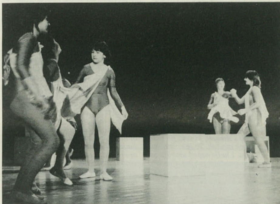
Vsak se v prostem času ukvarja z dejavnostjo, ki najbolj odgovarja njegovi kulturi. Tako je v nedeljo na eni strani KD Vodnik v Boljuncu prikazal dosežke mladincev, ki so obiskovali tečaj izraznega plesa, pri bližnjem Domju so pa «neznanci» pri spomeniku dokončali delo, ki so ga na oljčno nedeljo pričeli na občestni tabli.

Že prav, toda čemu niste razčistili teh vprašanj na deželi, kjer ste zavezniki in vam prav partnerji režejo vrat? Kaj reči o republikanskem in listarskem šovinizmu, če z njimi sodelujete? Mar ni groteskno, da smo edino kritično pripombo z nekega kongresa SSK na račun upraviteljev, slišali... v Zgoniku, kjer so na oblasti napredni Slovenci?