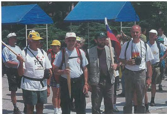
Krško: ekipo za prenos evrofona so sestavljali gozdarji in planinci