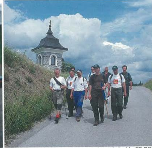
Velike Lašče: pridružili so se nam še nekateri kolegi iz CE ZGS