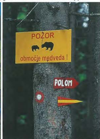
Gorjanci: pot je bila dobro označena, komu pa je namenjeno opozorilo na tabli, pa lahko le ugibamo