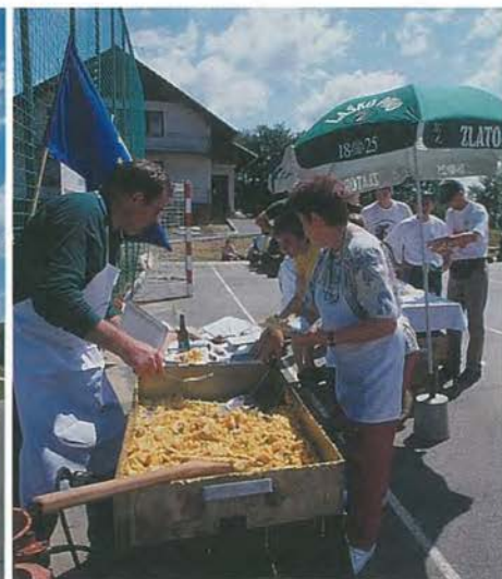
Zdole (občina Krško): za pohodnike so spekli 300 jajc, kar je komaj nasitilo lačno množico; k temu so se prilegle slastne jagode in seveda kozarček dobre kapljice