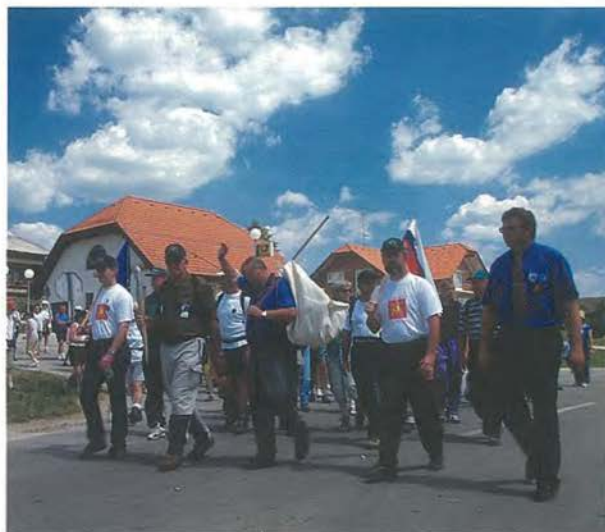
Hodoš: ob napovedanem času se je pričel slovenski del Evropohoda