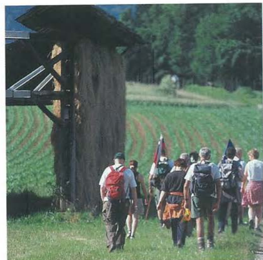
Dolenjske Toplice: ob poti smo lahko uživali ob pogledu na prelepo dolensko pokrajino in pogoste naravne ter kulturne zanimivosti