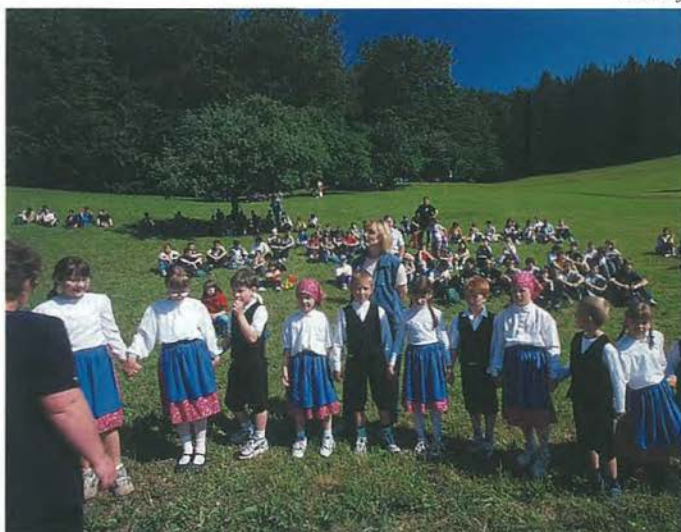
Križe (občina Krško): povsod so nas pričakali šolarji, ki so nas spremljali del poti in nam pripravili pristrčne sprejeme in pestre programe