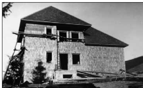
Šola v gradnji.

Krajevni šolski odbor je za novo šolo nabavil še najpotrebnejše orodje in pohištvo.