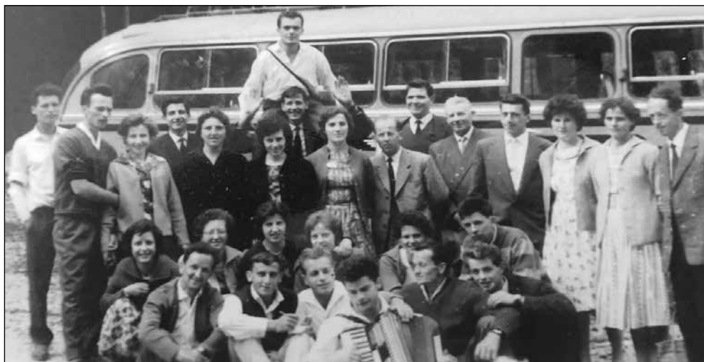
Člani Prosvetnega društva Martinj Vrh s prijatelji na zasluženem izletu.