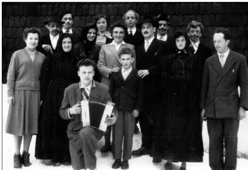
Igralci po predstavi drame Užitkarji.

tudi s finančnim poslovanjem in gospodarskimi problemi šole.