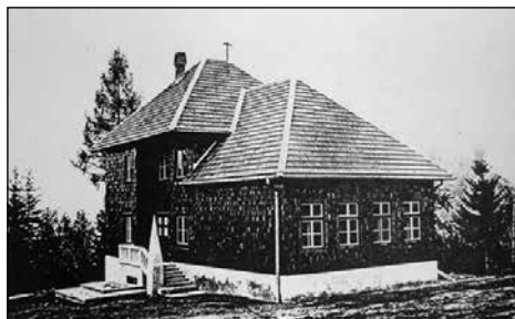
Nova šola jeseni 1936.