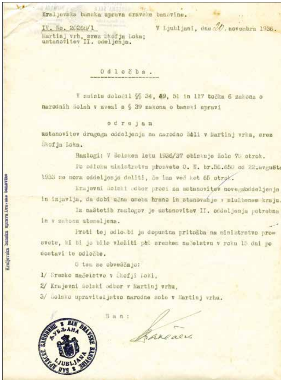
Odločba o ustanovitvi dvorazrednice.

kraljevska banska uprava je z odločbo 20. 11. 1936 dosedanjo enorazredno šolo razširila v dvorazrednico. Od kod ji je bil posredovan podatek, da je to leto na šoli 70 učencev, ni mogoče pojasniti.