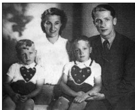
Vidmarjeva družina med vojno. Vir: Pilovška kronika, 2. del.

Martinj Vrh so najprej zasedli Italijani, ki pa so se čez teden dni morali umakniti Nemcem. Ti so šolo takoj zapečatili in tukajšnja učitelja spodili iz službe in šole. Streho sta našla pri Mohoriču. Kmalu so ju začele iskati nemške žandarmerijske in gestapovske patrolje, a so ju ljudje vedno pravočasno obvestili, da sta se lahko skrila. Vendar je postalo prenevarno