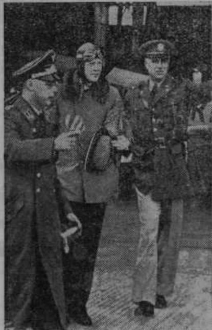
Znameniti ameriški letalec Karel Lindbergh (na sredi) se je udeležil v Münchenu na Bavarskem občnega zbora nemške letalske družbe.

Zelo resen položaj v Sveti deželi. Spredaj poročamo, da je proglasila nad Palestino angleška oblast radi vstaje arabskih plemen obsedno stanje. Arabci se pa očitno ne zmenijo veliko za ta korak, ampak hočejo z napadi dobro organiziranih skupin zlomiti angleško ter judovsko nadoblast v Palestini. V noči od zadnje nedelje na ponedeljek je izbruhnila po vsej Sveti deželi vstaja Arabcev. Posamezni vstaški oddelki ne napadajo samo manjših angleških policijskih patrulj, ampak so se že lotili tudi strnjenih angleških čet. Radi skrajno ogroženega položaja je bil 17. oktobra po vsej deželi zaustavljen železniški in cestni promet. Arabci so na več mestih razdrili železniške proge in čakajo v zasedah na avtobuse. Napadi Arabcev na jude se množijo in so se lotili judje samoobrambe. Splošno vstaško gibanje je tako naraslo, da mu Angleži zaenkrat še niso kos in je računati z daljšim vojnim stanjem. — Vrhovni arabski verski poglavar ali mufti v Jeruzalemu, kateri se je skrnil pred Angleži v Omarjevo mošejo, je pobegnil preoblečen v beđuina in je baje v Damasku. Ta mohamedanski mufti je eden glavnih organizatorjev upora in so ga hoteli Angleži pred tednom z drugimi arabskimi voditelji prepeljati v prognanstvo na samotni otok v Tihem Oceanu. Muftiju