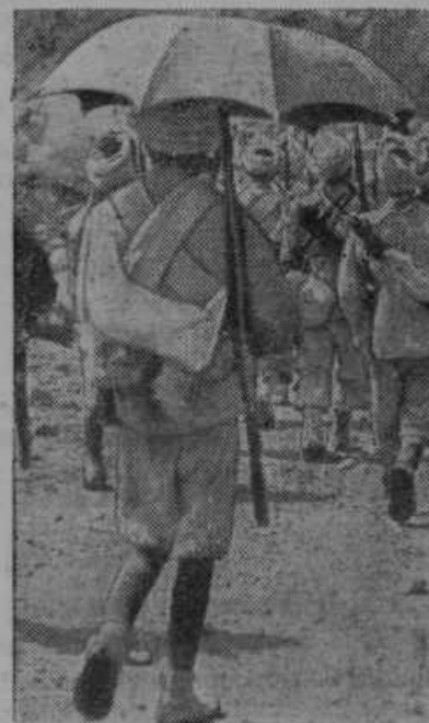
Kitajsko vojaštvo je opremljeno z dečniki.