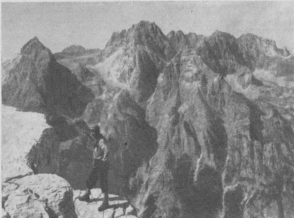
Pod vrhom zahodnega stebra, ki je videti od Aljaževega doma kot vrh Cmíra. Panoramo tvorijo od leve na desno Dolkova in Rakova špica, škrlatica, Spodnji in Visoki Rokar ter Oltar

le res, da so naju učili gamsi spoštovanja do svojih steza. Po razbiti, »mehki« in zračni polički sva se priplazila iz grape na zagruščeno gredino. Gamsi! Ne bi bil verjel, da pridejo tod čez, če ne bi šel sam po njihovih sledeh. In to je prav njihov pristop v Kuhinjo, saj se čez nekaj metrov na gruščnati gredi steza spet pokaže! Navzgor raste petstometerska nedotaknjena stena Nad Kuhinjo špice, v obliki obrnjenega trikotnika, ki se proti vrhu grozljivo širi in z zapadnim in severnim stebrom oklepa Kuhinjo tako tesno, da je le severno obzorje na Rokavskih grebenih nekoliko bolj odmaknjeno. Tako je mrk in resen ta kot, vase zaprt in grozljiv.