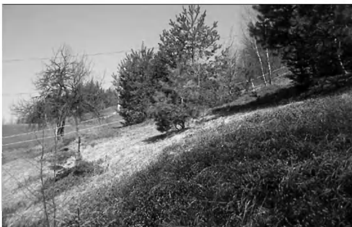
Rese na Zgončah zacvetele v čistem okolju