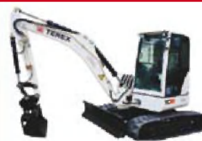
MINIBAGER 6 TON