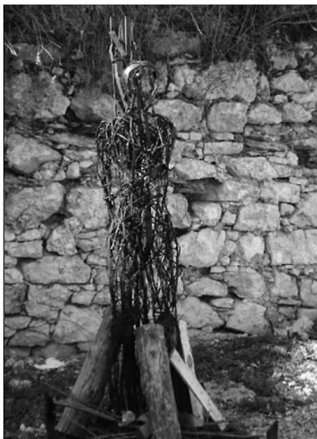
SKULPTURA NA DVORIŠČU GRADU TURJAK

Dušan Zekovič - HAZE je v okviru projekta TRUBARJEVI KRAJI IN LJUDJE – MITI, POVESTI IN LEGENDE izdelal tudi skulpturo »Dvorske Lucije«, ki jo je podaril za postavitve na osrednjem dvorišču gradu Turjak. Zanimivost skulpture je, da je nastala na podlagi njemu osebno pripovedovane legende in da je pod njo možno zakuriti, kar je po navedbah avtorja zaželeno čim večkrat.