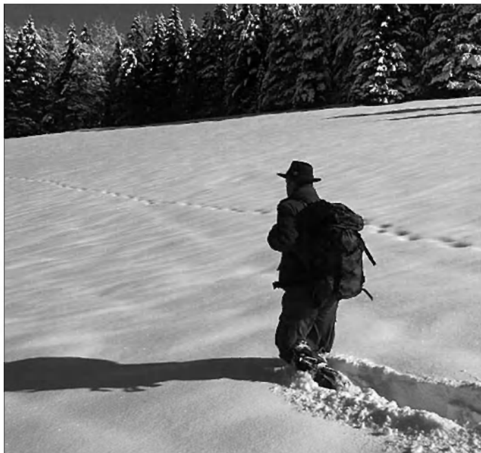
Protí zimskemu krmišču ...