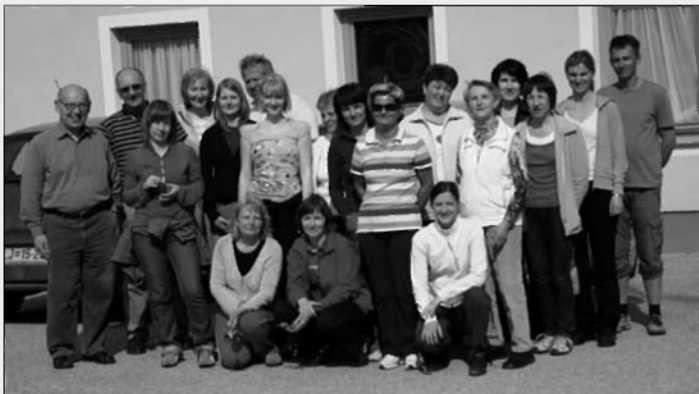
Za konec še ena gasilska.

1. maja smo končali uvajanje v meditacijo v Škocjanu pri Turjaku. Prvič sem bil v novem pastoralnem centru. Lep prostor, učilnica in kapela. Mirno okolje. Trubarjeva krstna cerkev. Predvsem pa čudovita skupina, ki je hitro stopila v tišino. Tako lepe