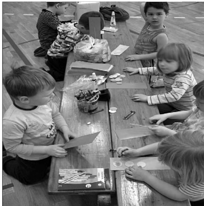
Delavnica: izdelovanje semaforjev