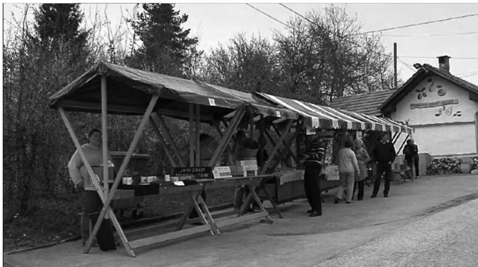
Stojnice Velikolaške tržnice

Kakšno je bilo življenje neke družine ob izdelovanju zobotrebcev, sta v avtentičnem okolju gradeške sušilnice