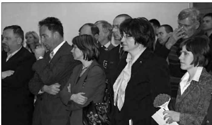
Številni gostje in sodelavci iz Slovenije in Hrvaške.

prevedli film, pripravljamo nove izobraževalne programe, načrtujemo skupne publikacije in akcije tudi z ostalimi partnerji v projektu.