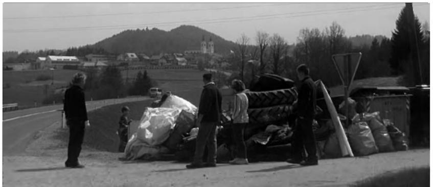
Odpadki na zbirni točki

Tudi občina Velike Lašče se je pridružila letošnji vseslovenski okoljski čistilni akciji. Tistega dne smo zavihali rokave in s skupnimi močmi poskušali očistiti čim več onesaženih površin. Ta dan je bilo v celoti saniranih 29 divjih odlagališč, očistili smo planinske in kulturne poti, obvodni svet potoka Rašice ter druge razpršene odpadke. Glede na primerljive podatke drugih občin smo v Velikih Laščah beležili visoko udeležbo. Čistilo je 573 prostovoljcev, kar pomeni skoraj 14 % prebivalcev, nabrali pa smo kar 85 ton odpadkov. Seveda je tukaj potrebno še omeniti, da so nekateri občani izkoristili to priložnost in na zbirne točke dodatno navažali svoje kosovne odpadke. V Občini imamo za ta namen organiziran dvakrat letno brezplačen odvoz kosovnega materiala. Stroške odvoza odpadkov v sklopu čistilnih akcij pa pomeni dodatno finančno breme za občino.