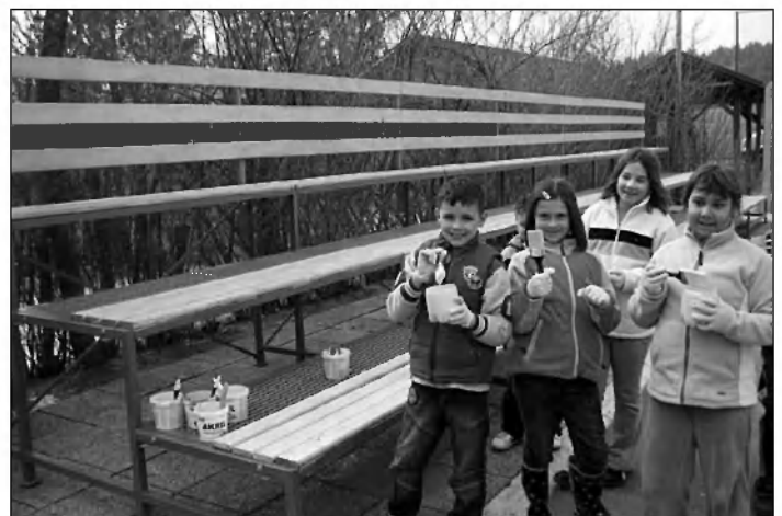
Učenci barvali klopi na igrišču in urejali okolico šole

Zavedamo se, da večine divjih odlagališč ne bi mogli počistiti brez ustrezne mehanizacije. Želimo se zahvaliti vsem za nesebično pomoč s svojimi traktorji, prikolicami in podobno, vsem društvom, krajevnim odborom in vsem ostalim prostovoljcem, ki so po svojih močeh kakor koli pripomogli k čistejšemu okolju naše občine.