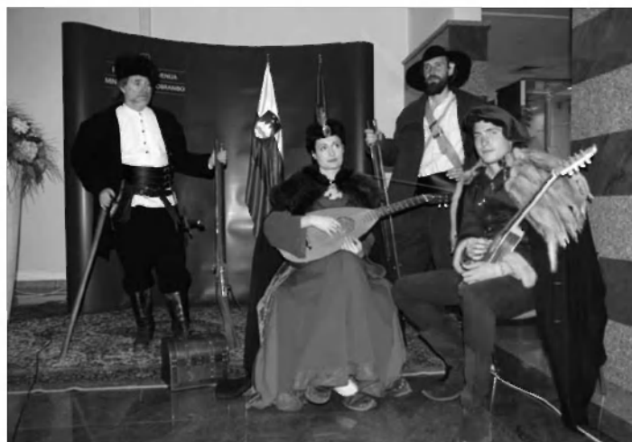
Za glasbeno doživetje in prikaz vojaške opreme iz 16. stoletja so poskrbeli člani Zavoda Svitar z gradu Struga.