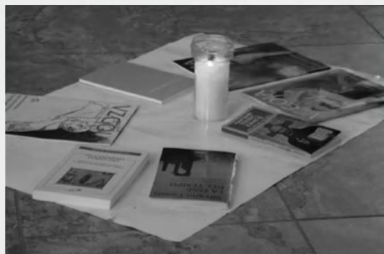
Včasih je že sveča in dobra knjiga dovolj, da se umiriš.

Meditacija, ki je potekala od 21. do 22. maja v Škocjanu pri Turjaku, je bila moja druga tovrstna meditacija, v kateri sem ponovno ugotovila, da je to priložnost, da prideš v globok stik s samim seboj, odpreš razmišljanja, ki niso del vsakdana. S tem, ko si v stiku s samim seboj in delaš na sebi, lahko prispevaš k večjemu medsebojnemu razumevanju (v družini,