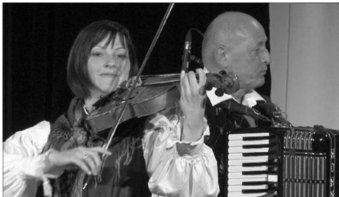
Del hišnega ansambla Avsenik.

Med publiko smo lahko opazili poleg številnih domačih obiskovalcev tudi precej ljudi iz okoliških krajev in občin. Temu so prav gotovo botrovali napovedani glasbeni gostje.