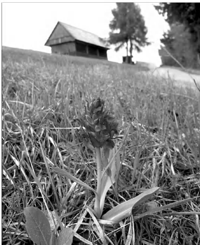
Suhe travnike v Rutah v maju polepšajo številne kukavičevke

Botanični sprehodi, ki jih zavod Parnas pripravlja v maju in juniju, so del obsežnejših akcij pod naslovom Rdeči seznam Mišje doline. Z njimi nadgrajujemo lanskoletne aktivnosti projekta Mokrišče - izziv za podeželje - tokrat smo se usmerili v popise zavarovanih rastlinskih vrst, ki jih najdemo na ekološko pomembnem območju Mišja dolina z Velikimi logi z okolico. Naše aktivnosti tudi letos podpirata Ministrstvo za okolje in prostor ter Urad vlade za komuniciranje.