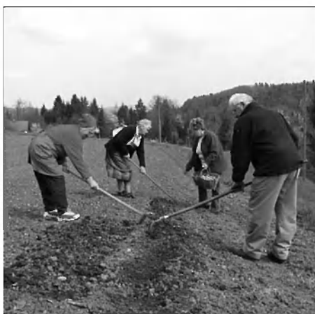
Sajenje krompirja kot nekoč

Na Gradežu se je pomlad tako praznovala tudi letos in aktivni člani Društva za ohranjanje dediščine ter vaščani že načrtujejo naslednje praznovanje v svoji vasi. Vabljeni tudi vi na Gradež!