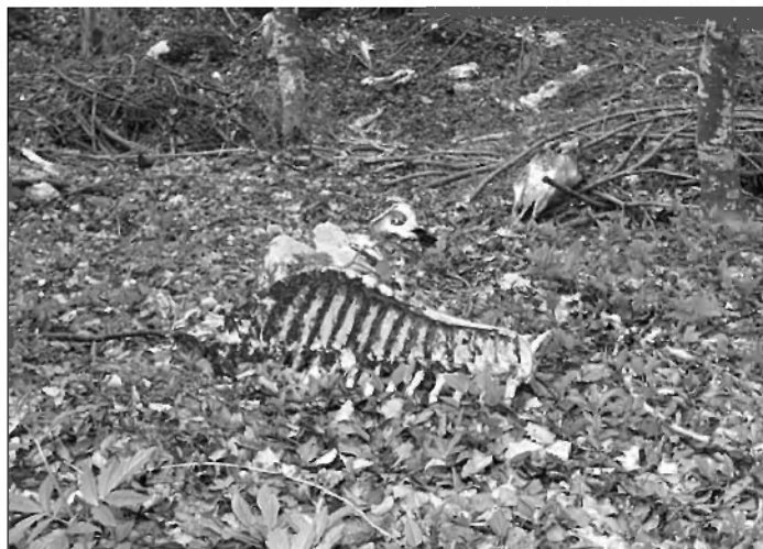
Klavni odpadki žrebet so bili odloženi že pozimi, divje živali so jih raznesli na površini cca 20 arov.