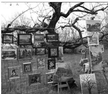
Likovna razstava in delavnica v sadovnjaku