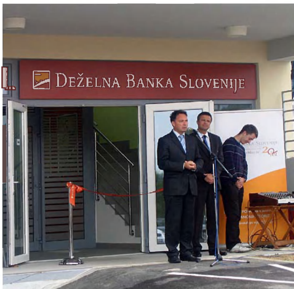
Župan je spregovoril ob odprtju nove poslovalnice Deželne banke Slovenije; foto Marija Ivanc Čampa.

26. marca 2010 je potekala otvoritev novega trgovskega centra. Prejšnji prostori trgovine zaradi lokacije in velikosti niso ustrezali vsem potrebam kupcev. Z novim centrom pa je kraj pridobil prostorno in bogato založeno prodajalno.