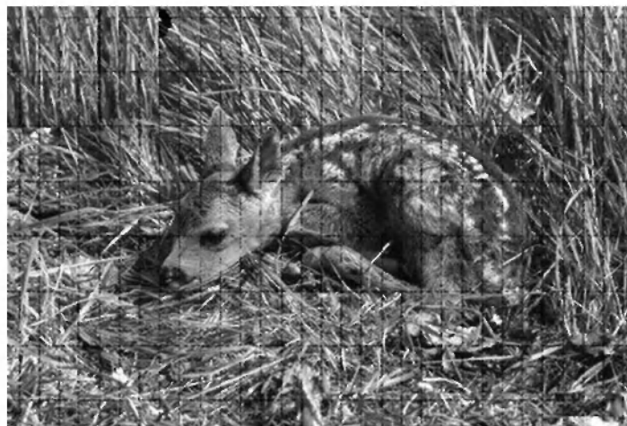
Ne dotikaj se me, moja mamica ni daleč!

Iz razmišljanja me je predramil pasji lajež. Ne navaden lajež. Lajež psa, ki preganja divjad. Sledi ji. On, v katerem se preliva kri njegovih volčjih prednikov ... Stisnilo me je pri srcu. V snegu, ki meni sega preko kolen, lahko srnjad zaradi svojih majhnih parkljev le nemočno poskakuje in se udara do trebuha. Plenilec pa, po zakonih, zapisanih v svoji prabiti, s svojimi širokimi, mehкими šapami, ki mu