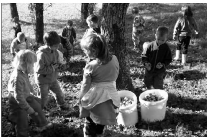
Zaboji so bili hitro polni