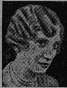
M. Podkrajšek frizer za dame in gospode, Ljubljana Sv. Petra cesta 12.

— Samo predsodek je, če kdo misli, da iz rži ni kave. V tisočerihih rodbinah uživajo ŽIKO brez primesi zrnate kave v popolno zadovoljnost. ŽIKO dobite v vsaki trgovini v rdečih zavitkih.