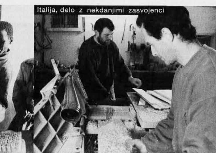
Italija, delo z nekdanjimi zasvojenici