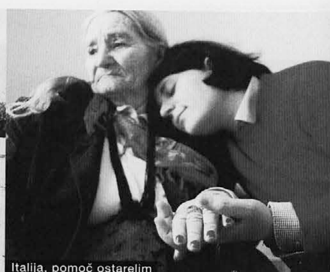
Italija, pomoč ostarelim