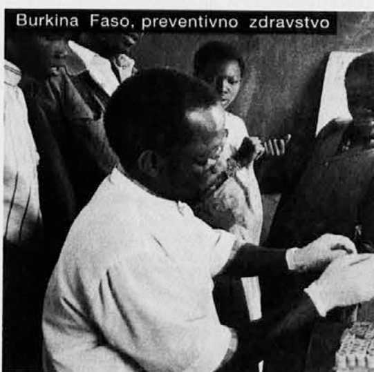
Burkina Faso, preventivno zdravstvo

CHIESA CATTOLICA - CEI Conferenza Episcopale Italiana