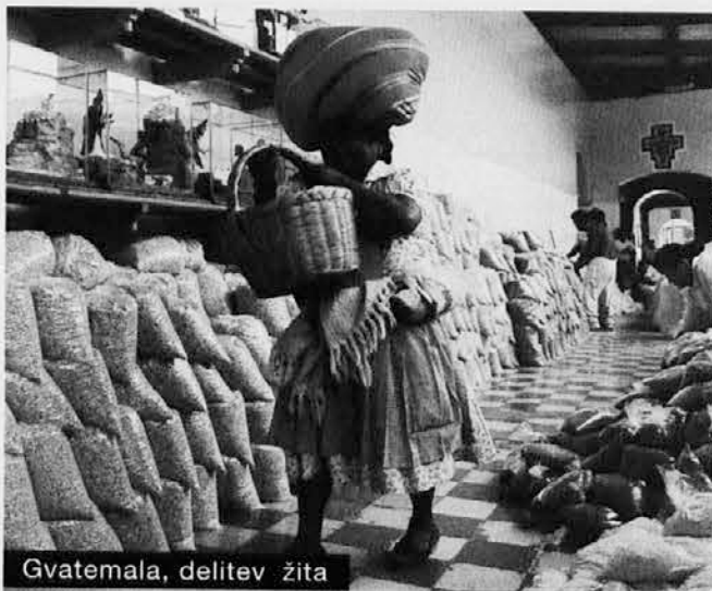
Gvatemala, delitev žita