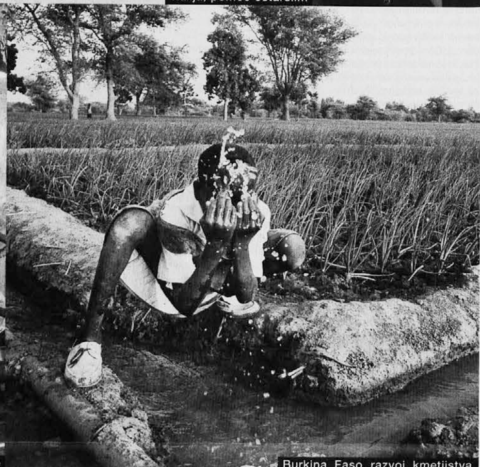
Burkina Faso, razvoj kmetijstva