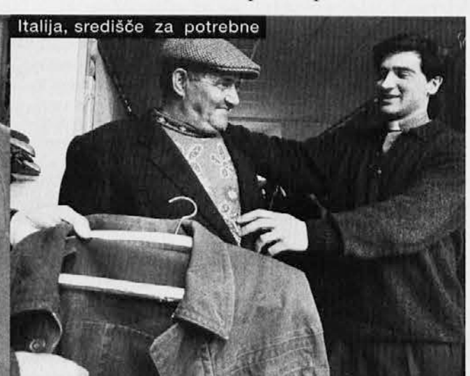
Italija, središče za potrebne