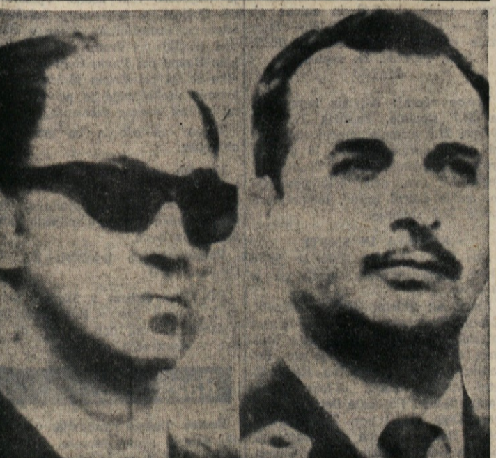
V zgornji vrsti: šef vojaške junte general Augusto Pinochet Ugarte in poveljnik mornarice admiral Jose Toribio Merino. V spodnji vrsti: poveljnik letalstva gen. Gustavo Leigh ter poveljnik karabinjerjev general Cesar Mendoza