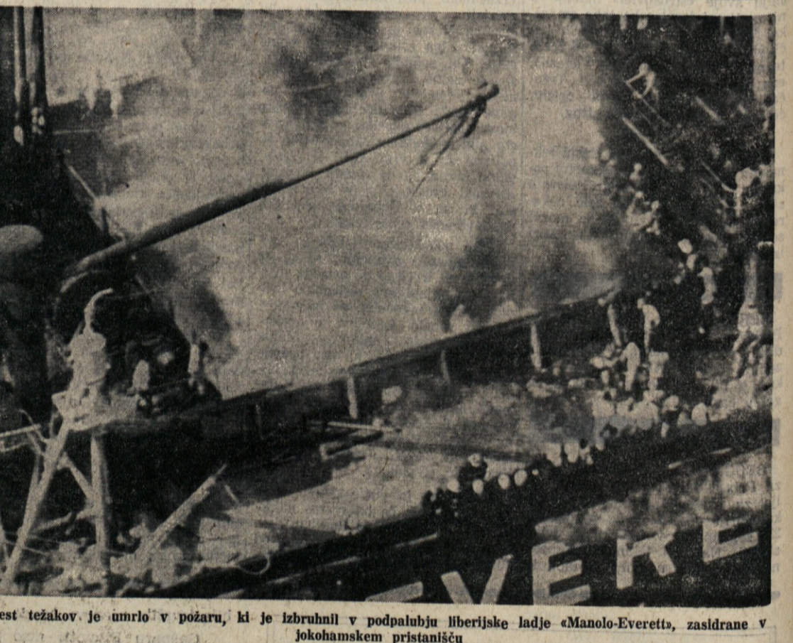
Šest težakov je umrlo v požaru, ki je izbruhnil v podpalubju lberijske ladje «Manolo-Everetts», zasidrane v Jokohamskem pristanišču

MILAN, 19. — Danes zjutraj je na oddelku za oživiljanje milanske