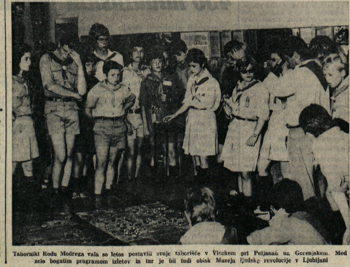
Taborniki Rodu Modrega vala so letos postavili svoje fabricišče v Visokem pri Poljanah na Gorenjskem. Med zvezo bogatim programom izletov in tur je bil tudi obisk Muzeja ljudske revolucije v Ljubljani

stite se vplivati od kapriciozne osebe. SERELEC (od 22.11. do 20.12.) Ne zaupajte predlogom, na osnovi katerih bi se povečale vaše nagloge, čustvene odločitve v najkrajšem času. KOZOROG (od 21.12. do 20.1.) Neki zapleten posel se bo iznebila pomostaviti ter ugodno rešil. Doživeli boste zadoščeno od strani družine. VODNAR (od 21. 1. do 19.2.) Okrepili boste poslovne odnose s sodelavci. Na delu boste imeli srečo. V čustvenem pogledu zaupajte bodočnosti. RIBI (od 20.2. do 20.3.) Spremembe in novosti glede na vaše bodoče delo. Zmagoslavje srčnih razlogov.