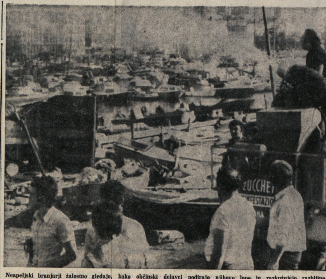
Neapeljski branjarji žalostno gledajo, kako občinski delavci podirajo njihove lope in razkužujejo razbitine