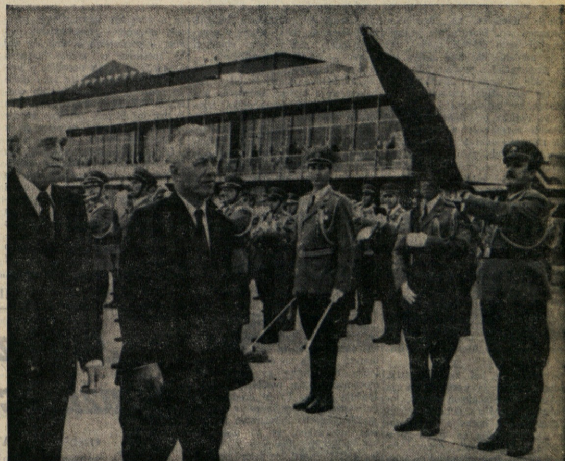
Podpredsednik predsedstva SFRJ Mitja Ribičič in predsednik sveta modrih začasne revolucionarne vlade Nguyen Huu Tho ob prihodu južnovietnamske delegacije na beograjsko letališče