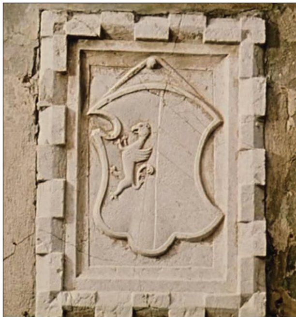
Slika 3: Grb družine Petronio.

dokumentih, ki zadevajo mestno skupnost, se omenjajo prisotne osebe, pooblaščenci in mestni funkcionarji. Tudi tu so osebe označene s priimki/vzdevki ter imenom očeta ter občasno drugega sorodstva (brata ali bratov), iz katerih je možno ugotoviti pomembnejše moške člane družine in sorodstvene povezave med njimi.