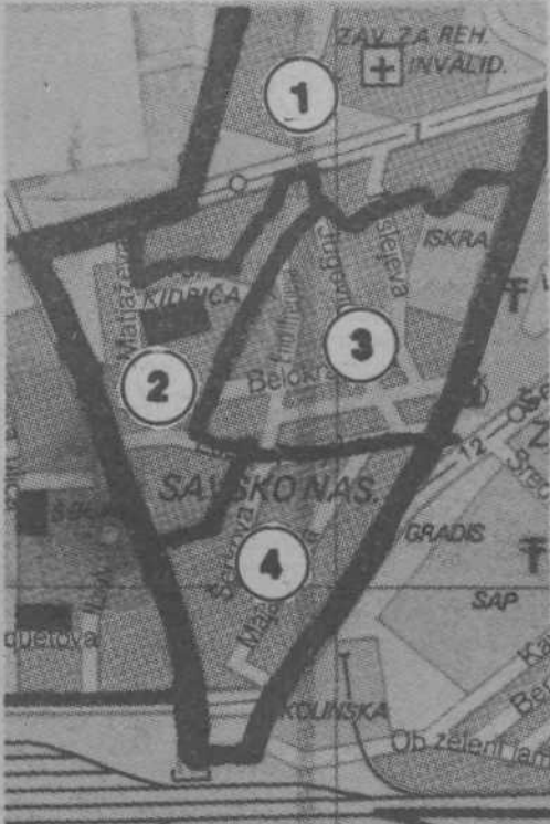
KS Savsko naselje - na štiri dele