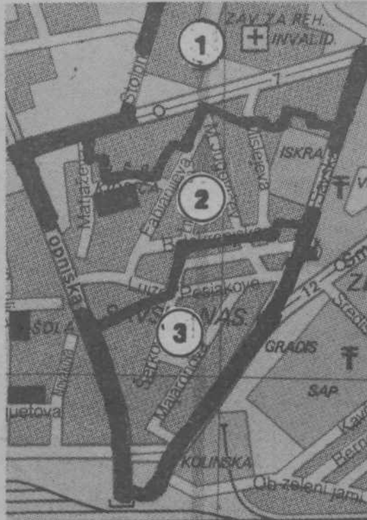
KS Savsko naselje - na tri dele

V analizi delovanja krajevnega konference Savsko naselje so obširno ocenili tudi ustavne naloge samoupravne enote - krajevnega skupnosti. Zato se tudi zavzemajo za takšno preoblikovanje svoje krajevnega skupnosti in oblikovanje novih, v katerih bo možno neposredno vključevanje vseh delovnih ljudi in občanov v samoupravno in družbenopolitično življenje, hkrati pa učinkovito uresničevanje nalog te skupnosti.