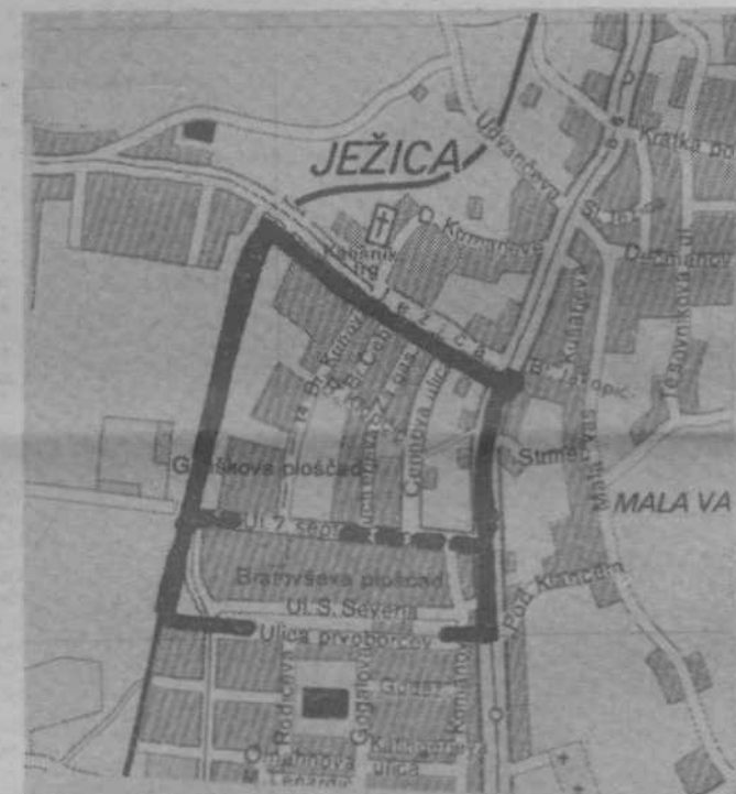
KS Urške Zatlereve

V krajevni skupnosti Urške Zatlereve so prvi pripravili gradivo o preoblikovanju; objavili smo ga že v drugi letošnji številki našega glasila. Javna razprava o predlogu: iz sedanje krajevnega skupnosti naj bi nastali dve novi, se je začela že januarja, pa kljub temu še vedno ni končana. Ugotovili so namreč, da v nekaterih stav-