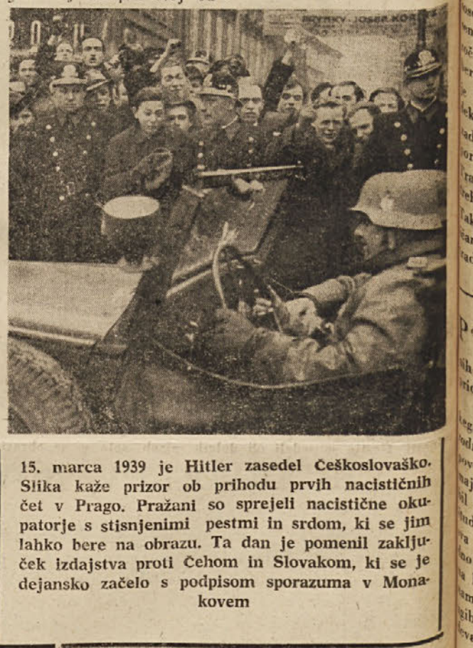
15. marca 1939 je Hitler zasedel Češkoslovaško. Slika kaže prvor pri pridochu prvih nacistih čet v Prahu...