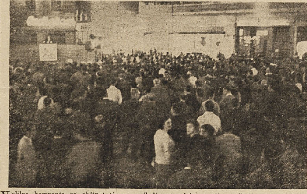
Volilna zborovanja v Trstu

Volilna kampanja za občinske volitve v Trstu je v polnem teku. Doslej je Komunistična partija pripravila največ volilnih zborovanj. Razen večjih zborovanj na mestnih trgih, v predmestjih in v vaseh gorne mestne okolice, je naša partija pripravila tudi mnogo letičnih govorov in sestankov.