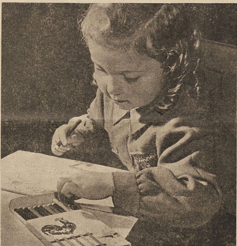
1. oktobra se bodo ponovno odprla vrata osnovnih šol. Tako bodo po dolgih poletnih počitnicah šolska poslopja ponovno postala drug dom učenčev mladih. Za tiste malčke, ki bodo tokrat prvič prestopili šolski prag, bo ta dogodek pomenil pravo prelomnico na njihovi življenjski poti. Šola v Gropadi pa je bila ustanovljena kasneje.

Vse gori navedene šole obstajajo še danes, le šoli na Kontovelu in Proseku sta se leta 1854 združili v eno samo šolo za obe vasi, ki prav tako še danes obstaja.