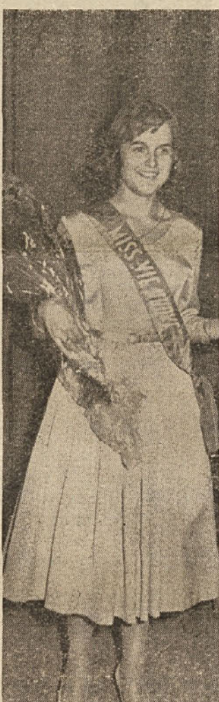
MAJDA TENGE IZ KRIZA

Kriški ljudski dom, okrašen z rdečimi zastavami in zelenjem je v nedeljo v okviru praznika komunističnega tiska, nudil svečan vtis stotinam delavcev iz Križa, sosednih vasi in mesta, ki so prihitali na lep praznik, da dokazuje svojo strnjeno okrog komunističnega tiska.