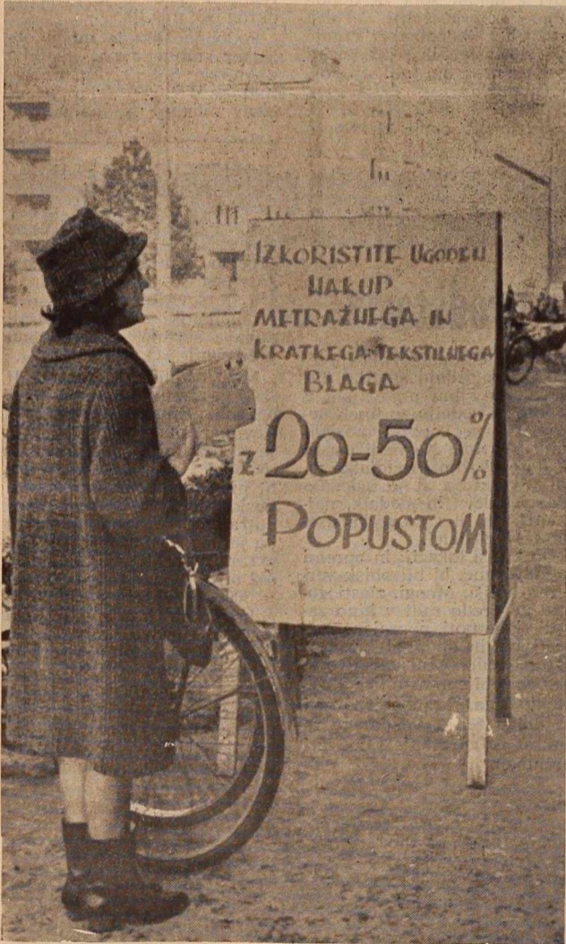
V času inventur so se tudi v Murški Soboti pojavila simpatična obvestila o znižanih cenah raznega blaga. Žal pa so take napisne table po enem ali dveh dneh izginile izpred prodajalnic, kar zgovorno dokazuje, da so potrošniki v Pomurju vzeli tak popust hudo resno.