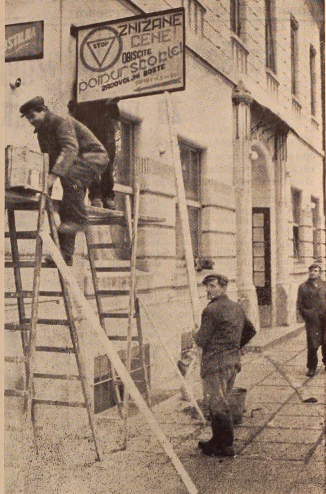
Ko so ondan pred hotelom »Central« urejali napisno tablo ko znižanih cenah v »Pomurski kleti« si hudomušneži niso mogli kaj, da ne bi s pikrimi pripombami proslavili tega redkega dogodka. Najbolje se je vsekakor odrezal duhovitež, ki je oznanil, da tudi znižane cene ne morejo biti kdo ve kako nizke, ker jih še vedno podpirajo z letvo.

ODGOVOR: V Rakičanu na pr. je urejena šolska poliklinika pri pediatričnem oddelku, toda nekateri trdijo, da ni pravilno locirana. Pri Gradu je že nekaj let nova zobozdravstvena oprema - ki se je še ni nihče dotaknil. Podobno je z zobno ambulanto v Turnišču. Sicer pa je težko reči, da so naše zdravstvene ustanove dovolj opremljene, kajti v sodobni medicini se poslužujejo v svetu zelo dognanih instrumentov. Vsekakor je v našem zdravstvu še premalo strokovnega kadra. Veliko štipendiram, toda veliko ljudi tudi odide po končanem študiju iz Pomurja.