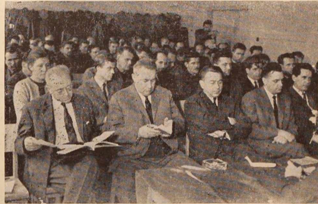
Udeleženci letne konference ZK v kmetijsko-industrijskem kombinatu »Pomurka« v Murski Soboti

Udeleženci konference so pozitivno ocenili uspešno združitev kmetijskih zadrug ravniškega predela s kombinatom, vendar pri tem niso prezrili nekaterih slabosti, ki spremljajo konsolidacijo in usklajevanje kmetijske proizvodnje. Vsekakor vpliv subjektivnih činiteljev, predvsem organizacije ZK, ni bil dovolj odločen, da bi prišlo na primer do boljših poslovnih odnosov med posameznimi obrati, kar bi bilo ob povečanem