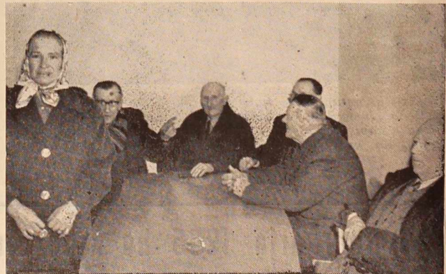
Pred nedavnim so se na sedežu organizacije Zveze borcev NOB v Murski Soboti prvič sestali še živeči Maistrovi borci, ki so zvečine tudi člani te organizacije. Na majhni svečanosti so jim podelili tudi po 10.000 dinarjev priznavalnine kot prispevek okrajnega združenja borcev v Mariboru. Velja omeniti, da živi na področju Pomurja danes še 27 bivših Maistrovih borcev, ki se kljub visoki starosti še vedno aktivno udeležujejo v javnem življenju.