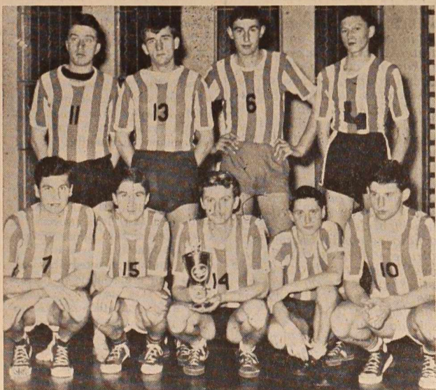
Košarkarji Partizana iz Murske Sobotice, zmagovalci nedavnega turnirja v Radencih.