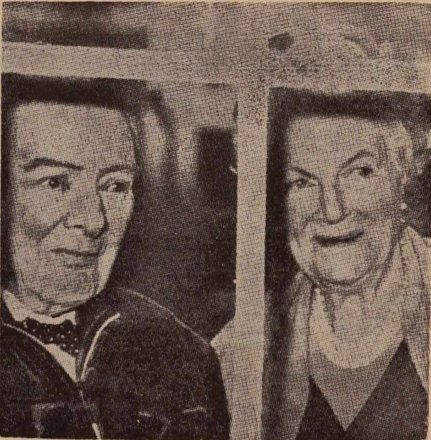
Winstone Churchill (levo)

Nekdanji britanski ministrski predsednik sir Winston Churchill eden največjih britanskih državnikov in politikov novejšega časa, je komaj v svojem enainvedesetem letu prebolel napad cerebralne tromboze kot posledice prehlada in motenj v krvnem obtoku. Nekaj dni je trajala njegova bitka z boleznijo, dokler slednjič ni zmagal. In ta boj za življenje je spremeljal ves svet s posebno pozornostjo in s čustvi tihega sozolja z veliko osebnostjo.