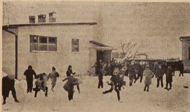
Veselite med odmorom pri osnovni šoli v Salovcih

raste, ko se vrnejo s sezonskega dela občani obmejnih vasi, ki prinašajo tujo valuto, zato je podjetje v ta namen organiziralo menjalnico v Martinjcu in Šalovcih. V nekaterih primerih poslovalnice s svo-