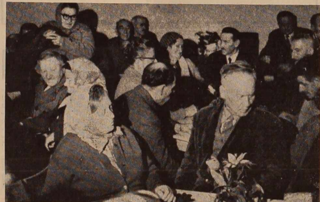
Klub upokojencev v Ljutomeru, ki sta ga za najstarejše prebivalce priške metropole uredila s skupnimi močmi ljutomerska krajevna skupnost in občinska skupščina, je postal priljubljeno zatočišče za več kot 200 članov društva upokojencev. Žal je en sam klubski prostor postal pretesen za številne obiskovalce, zato bodo kmalu dobili upokojenci iz Ljutomera še en prostor za shajanje.