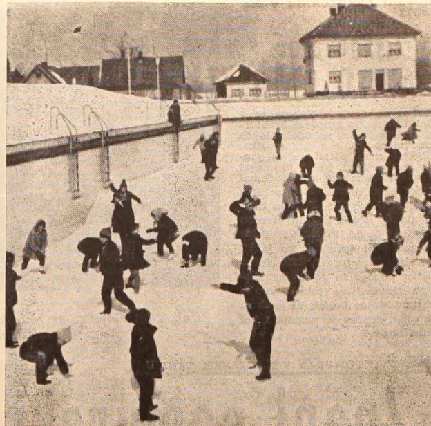
Radenski bazen tudi pozimi ne ostane neizkoriščen. Kadar ga pokrije snežna odeja, se v njem kaj radi znajdejo šolarji in vrtičarji, ki se veselo kepajo in grebejo po mehkem snegu...

V lanskem letu je društvo organiziralo več predavanj in posvetovanj, prav tako pa so skrbeli tudi za odkup medu pri članih ter za nabavo sladkorja po grosističnih cenah. Dne 26. in 27. jan. bo organiziralo društvo tudi tečaj za čebelarske izvedence. Težnja je, da bi imela vsaka vas po enega čebelarja, ki bi bil seznanjen z odkrivanjem čebeljih boleznih. Na tečaju se bo-