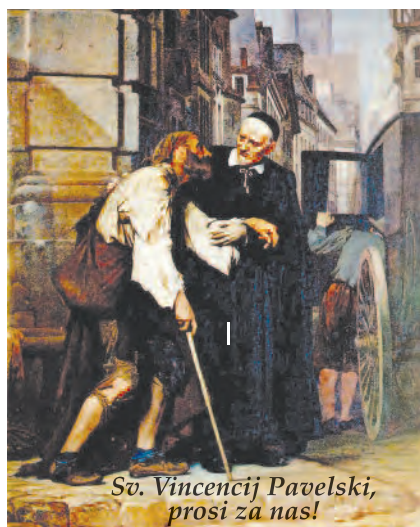
Sv. Vincencij Pavelski, prosi za nas!