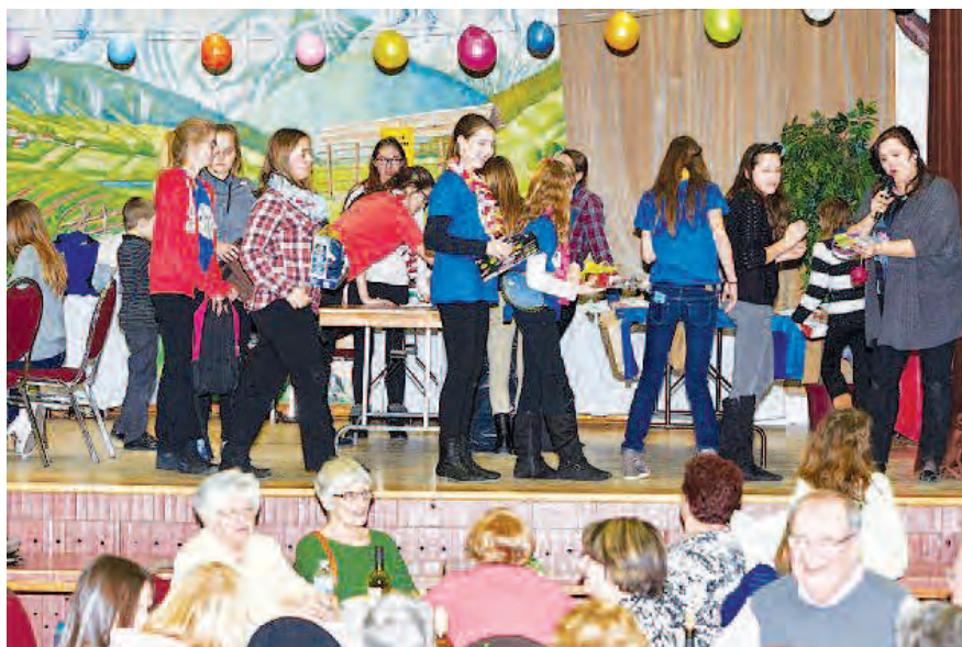
Mladi dejavni pri župnijskem bazarju

28. feb. so v dvorani društva Sava v Breslavu praznovali 25 let ansambla 'The Golden Keys' . Na večerji in praznovanju je bilo okoli 150 gostov.