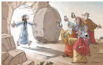
Tako bi bilo danes