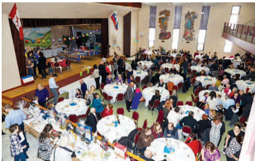
Vsakoletni župnijski bazar pri sv. Gregoriju Velikem

18. feb. je pepelnica vsem naznanila začetek posta.