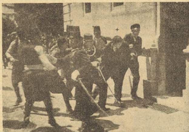
Aretacija Gavrila Prinčipa

Letos na Vidovdan bo minilo 25 let od onega usodnega zgodovinskega Vidovdana, ko je naš narodni heroj Gavrilo Princip s svojim strelom »prvi oznanil svobodo svojemu narodu« kot je napisano na spominski plošči na kraju atentata.