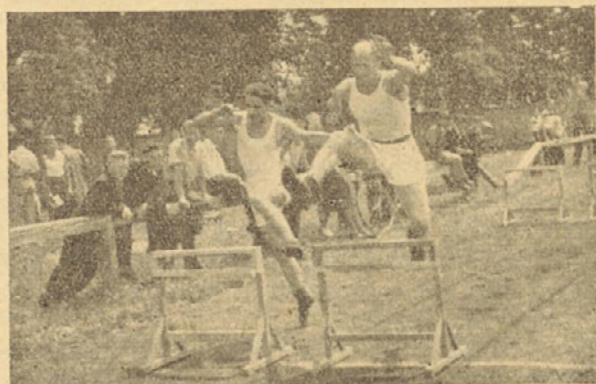
Z župnih tekem

Res lep korak naprej je napravilo naše Sokolstvo z uvedbo teh krojev. V praksi smo dali s tem duška našim pogledom do estetike. Tudi v nagnjenju do lepega in okusnega se kaže naša notranja usmerjenost. Paziti bo treba in to z vso strogostjo, da se zatre in odstrani takoj vsako samovoljno prilagojevanje kroja s strani posameznikov, ki bi kršilo predpise o novih krojih. V mislih imam pri tem dolžino hlačk in kril ter enotnost barv. V tem oziru naj bodo tehnični organi budni čuvarji, kajti kroj doseže svoj namen le, če je pri vseh posameznikih, ki ga nosijo, do potankosti enak. Vsaka izjema kvari in ubija celotni vtis. Mislim in želeti bi bilo, da je sedaj vprašanje naraščajskih krojev dokončno rešeno. Ali ne bi bilo dobro pomisliti nekoliko tudi na spremembo dečjih telovadnih krojev, ki so jih sedaj novi blesteči naraščajski kroji močno potisnili v ozadje? Delna reforma tudi tu po mojem mnenju ne bi škodovala.