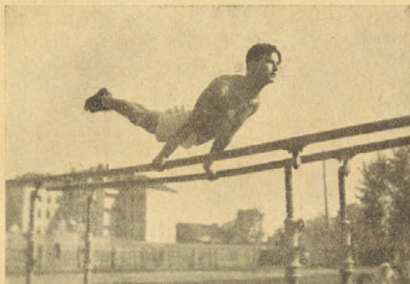
Br. Grilec na bradlji

težje, so Francozi polagali važnost na sigurnost in mirno izvedbo. Druga točka: Konj na šir z ročaji. Tu je vse spremljala precejšnja smola. Od naših bratov razen mene ni napravil nikdo cele vaje. Glavni vzrok je pač nesigurnost in pa trema. Tudi Francozi se niso bolje odrezali. Edino njihov prvak je vajo odbil lepo in čisto. Pri naših bratih bo treba še mnogo vaje, da bodo pokazali to, kar se za mednarodne tekme zahteva. Tretje orodje je bil drog. Tudi tu smo dosegli lep uspeh. Francozi so imeli nekaj težkih prvin kot veleteč v vesi zadaj, lepe raznoške in premahe ter tudi boljše povezane prvine. Pri tem orodju so tudi izravnali razliko, s katero smo mi dosedaj vodili. Sledi bradlja, ki nam je prinesla zopet nekaj naskoka. Naše vaje so bile res na mednarodni višini. Francoska