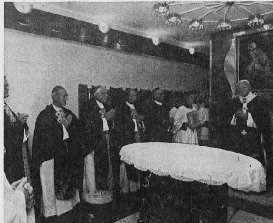
Somaševanje v kapeli Slovenika; sv. oče s slovenskimi škofi

Podobno kot druge dežele Vzhodne Evrope tudi Jugoslavija doživlja v tem letu zgodovinske spremembe in prehod v