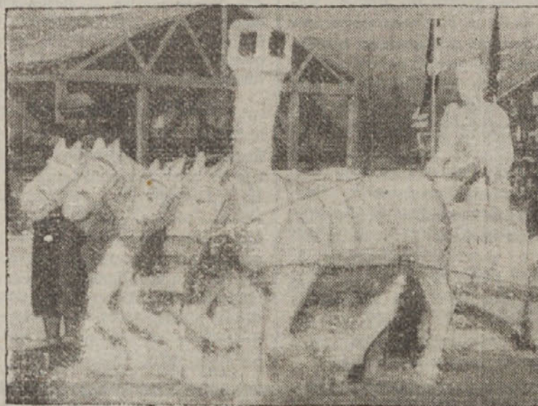
Tudi umetniki, ki so obiskali Ga-Pa, nočejo zaostati in spravili so se nad sneg. Slika kaže antični olimpijski voz, ki ga je iz snega naredil neki kipar

Kr. banska uprava razpisuje oddajo gradbenih del Podpeškega mostu in mostu čez Radovno v Krnici. Licitacije se vršijo na tehničnem oddelku kr. banske uprave.