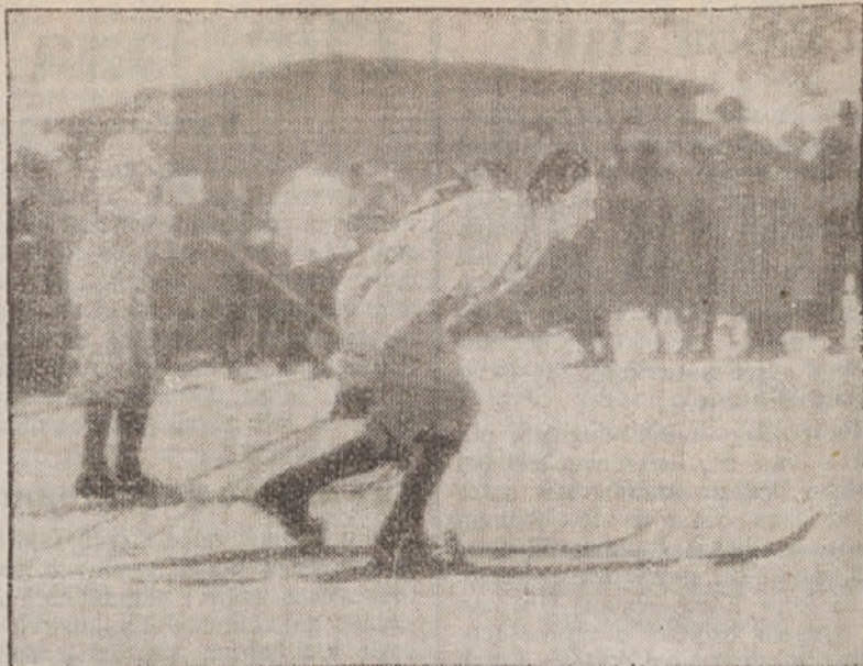
Slika kaže menjavo Švedov v štafetnem teku na 4 krat 10 km v Ga-Pa, ki se je vršila v ponedeljek. Borba se je vršila v glavnem med Finci, Norvežani in Švedi. Zmagali so Finci s 6 sekundami. Mi smo bili na 10. mestu. Slika je bila poslana telegrafsko iz Ga-Pa

Dne 4. junija 1935. je v St. Slemenu umrla 76-letna prevžitkarica Apolonija Pečovnik, ki je napravila tudi oporoko, v kateri je omenjeno, da tvori njeno zapuščino gotovina 15.000 Din, kateri znesek pa je vknjižen kot terjatev na zemljišču posestnika Ludvika Z. od 17. 9. 1928. Za dedinjo pa je v oporoki označena Cecilija Rebernak.