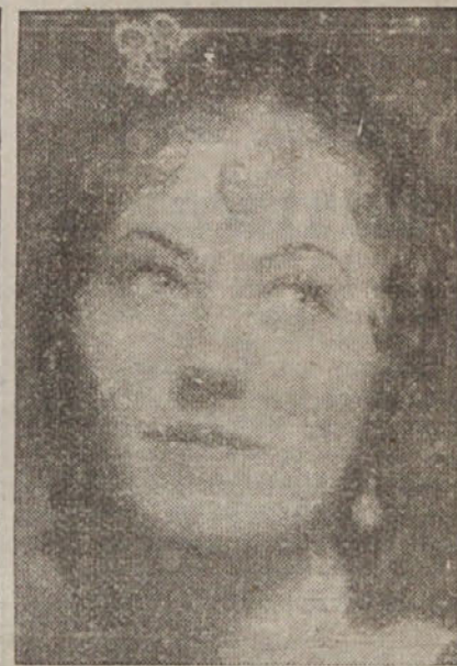
Vedro hrepenenje, ki si vselej osvoji moža