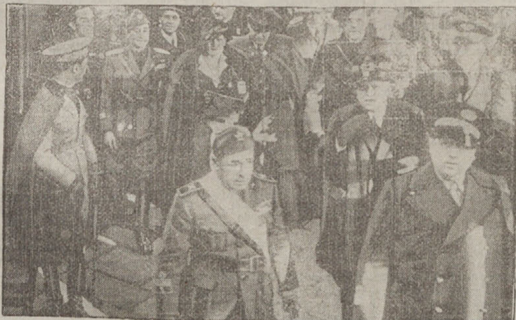
Slika kaže prvake fašistične Italije: tajnika stranke Staraceja, bivšega tajnika Farinaccija, ministra Ciana in Bonomija, ki so odpotovali na bojišče v Severno Afriko. Ljudstvo jih je ob tej priliki navdušeno pozdravljalo