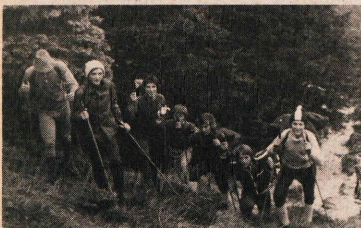
S TRENINGA SMUČARJEV — TEKAČEV