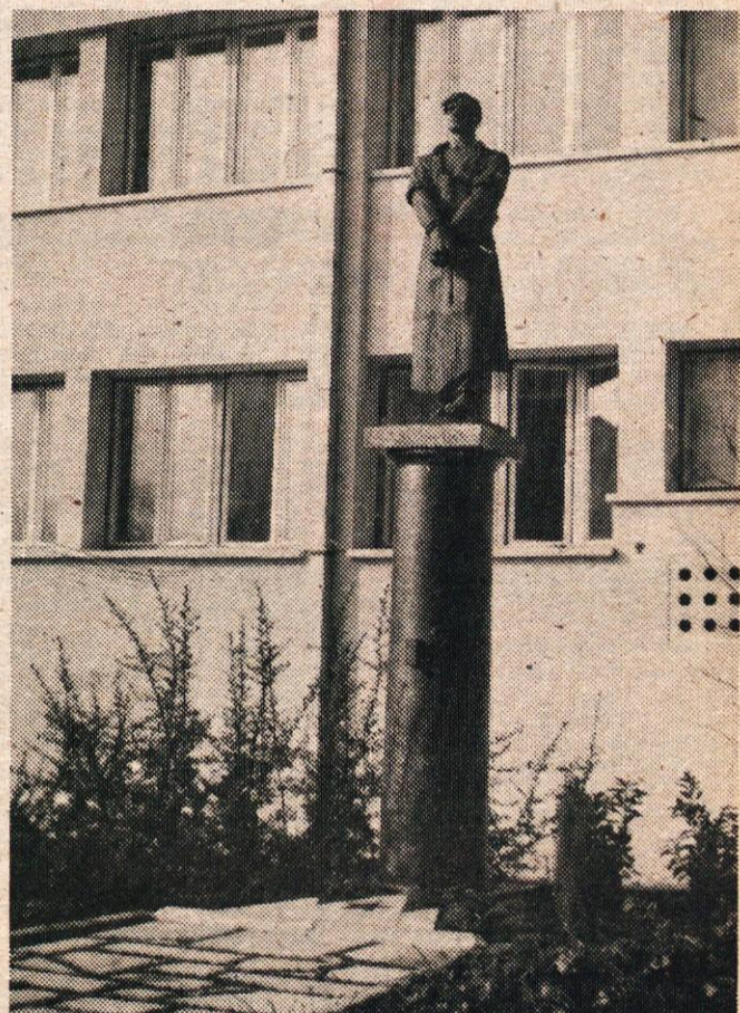
Tovarna usnja UTOK v Kamniku slavi 28. novembra 50-letnico podjetja. Proslava bo v hali v Domžalah. V kulturnem programu v zvezi s proslavo bo nastopila tudi tovarniška recitacijska skupina z recitalom „Pred puškami stojim“. S tem bodo seveda tudi počastili spomin na številne žrtve iz kolektiva, ki so junaško padle med osvobodilno vojno, kakor usnjarski talec, upodobljen v kipu pred vhodom v tovarno, ki v usnjarskem predpasniku z zvezanimi rokami prezirljivo zre v puškine cevi.