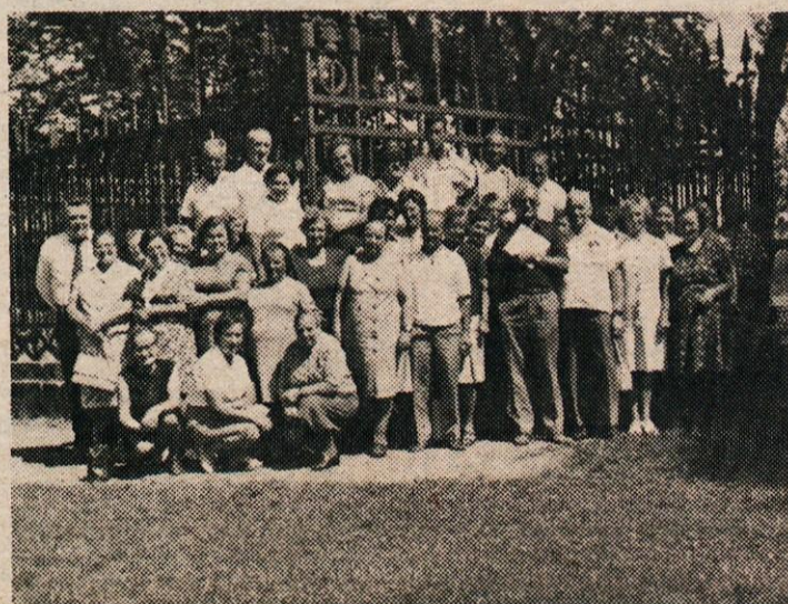
UPOKOJENCI PRED KNEŽJIM STOLOM