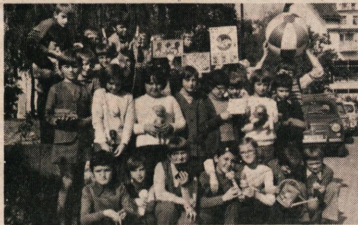
POGLEJTE, TO SMO MI ZBRALI