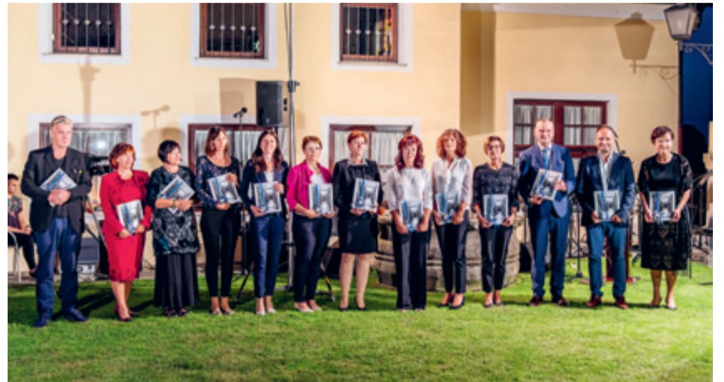
70 let delovanja Knjižnice Ivana Potrča Ptuj so knjižničarji obeležili z izdajo jubilejnega zbornika in z razstavo prestižnih knjižnih izdaj

elektronskih arhivov serijskih publikacij, skrbi za digitalizacijo knjižničnega gradiva in njegovo vključitev na domoznanski portal Kamra ( www.kamra.si ) in Digitalno knjižnico Slovenije ( www.dLib.si ), s čimer zagotavlja trajno ohranjanje knjižničnih gradiv in pisne kulturne dediščine nacionalnega pomena. V dLib je prispevala ok. 145.000 strani digitaliziranega gradiva, kar jo uvršča na visoko drugo mesto med slovenskimi splošnimi knjižnicami. Zaživel je tudi spletni biografski leksikon znanih osebnosti Spodnjega Podravja ( www.spodnjepodravci.si ), ki prispeva k osvetljevanju zgodovine našega področja ter dosežkov njegovih posameznikov. Od povojnih časov do danes sta se podoba in vloga knjižnice močno spremenili. Iz nekdanje izposojevalnice knjig se je razvila v sodoben kulturno-informacijski center, ki ponuja široko paleto storitev, od kulturno-izobraževalnih do socialno-družbenih. Ves čas svojega obstoja je morala loviti ravnotežje med Scilo zakonskih predpisov, strokovnih normativov in standardov ter Karibdo finančnih zmožnosti okolja, v katerem deluje. Kljub mnogim težavam, ki jih je na svoji poti morala premagati, pa je vztrajno sledila spremembam v družbi in stroki in se strokovno in organizacijsko razvijala.