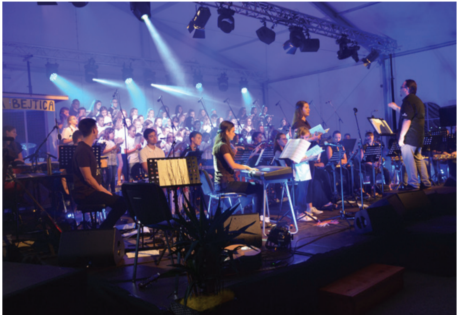
Zbrani pevci, pevke in člani orkestra na zaključnem koncertu.

In tako se je praznovanje jubileja začelo. Od 19. do 24. avgusta se nas je v središču naše občine pod prireditvenim šotorom družilo 50 tabornikov, 19 animatorjev, 4 kuharji in "upokojeni" animatorji (3 bivši animatorji in 9 bivših tabornikov). Ker smo tabor vseeno želeli ohraniti "običajen", programa nismo bistveno spreminjali. Po bujenju je sledila tabornikom "najljubša" jutranja