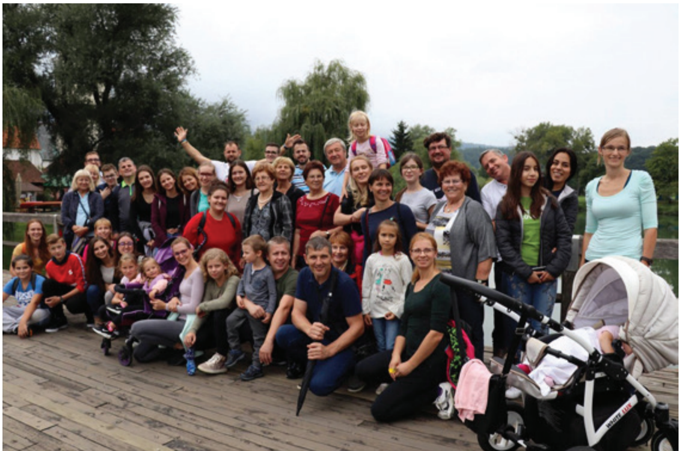
Člani društva so se na letošnji zaslužen izlet odpravili v Posavje.

Tudi najmlajši Zvončki so ob nedeljah pred mašo spet zbrani na pevskih vajah. Cerkveno revijo mladinskih zborov so v juniju več kot uspešno zastopali, nato pa se podali na počitnice do avgusta, ko jih je čakal mladinski glasbeni tabor, letos jubilejne narave. V omenjenem projektu so sodelovale vse sekcije društva, saj je terjal kar nekaj organizacije in koordinacije. Ne smemo pozabiti tudi na Cerkveni pevski zbor Jutranja zarja, ki je reden pri nedeljskih ranih