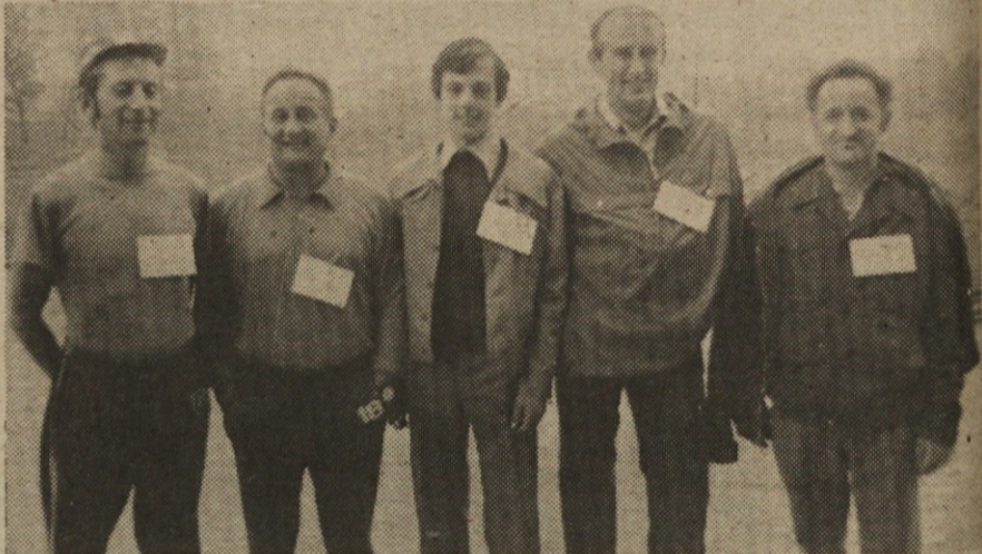
Edina ekipa Elektromehanike in še ta okrepljena z mladincem (za večji polet) izmed mnogih, ki jih je deževno vreme zadržalo pod toplo odejo.