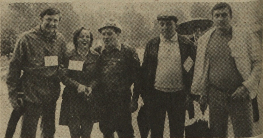
Tej ekipi TOZD Avtomatike je manjkal peti član, a je uspešno vskočil naš novinar Lado in je lahko nastopila.