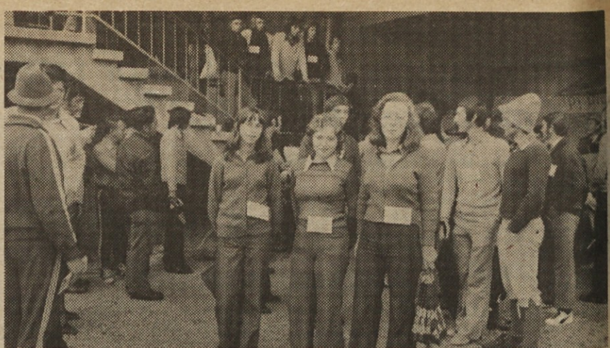
Prva je štartala ženska ekipa Šolskega centra s številko 3.

Po končanem I. pohodu so se udeleženci zbrali v Park restavraciji, kjer sicer ni bilo uradne razglasitve rezultatov, pač pa je ob klobasi, dobro zasluženih in ob sokovih, kot se za športnike spodobi, tekla živahna debata o „dozivetjih“ na našem I. pohodu prijateljstva Iskraev, ki je kljub slabemu vremenu in odsotnosti velikega števila prijavljenih tekmovalcev, uspel. Organizatorji so si z njim pridobili prve izkušnje in, če jim bo prihodnje leto vreme bolj naklonjeno, lahko pričakujemo lepo in množično športno rekreacijsko manifestacijo. —C—