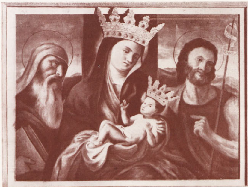
V MOLITVI PRED MILOSTNO PODOBO SVETOGORSKE KRALJICE