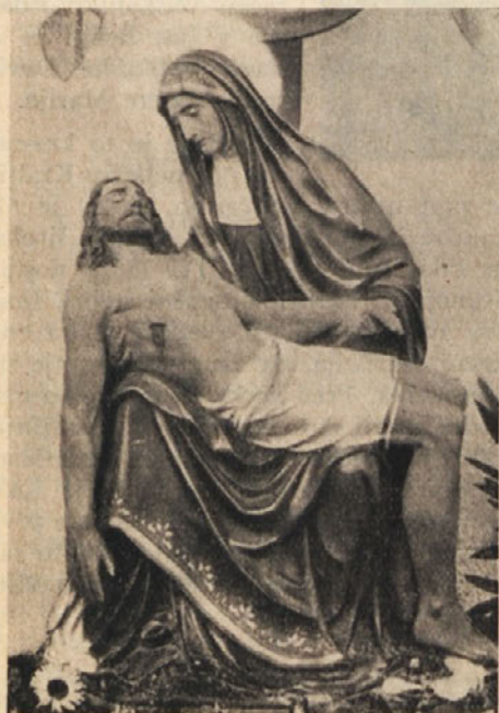
Kip Zalostne Matere božje z Jezusom v naročju

Ti varuhi Marijinega svetišča so živeli po zgledu egiptovskih puščavnikov. Hranili so se s figami, ki tukaj na prostem rastejo. Obdelovali pa so tudi male vrtove, kakor kažejo zapuščene dolinice, ki so bile nekdanj obdelane in ograjene. In od teh ograj se morda imenuje ta