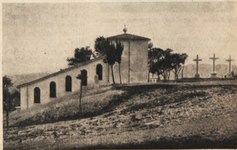
„Svete stopnice“ na Mirenskem Gradu

ce pod streho. Veličastna cerkev je 42 metrov in pol dolga, 22 metrov široka in tako tudi visoka. Tri ladje nosijo dvanajsteri okrogli mogočni stebri. Ima dva zvonika. Zraven svetišča je na eni strani zakristija, na drugi stanovanje za duhovnika. Pred cerkvijo je na jugozahodni strani stara cerkvica in poprejšnja hiša duhovnega oskrbnika ali beneficijata; na severozahodni strani pa je Kalvarija in „svete stopnice“, ki so pa v prvi svetovni vojni bile razdejane. Kmalu zatem pa je vodstvo svetišča postavilo nove.