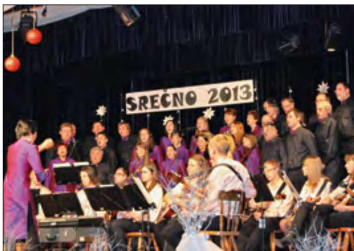
Mešani pevski zbor iz Črešnjevca s tamburaškim orkestrom iz Majšperka