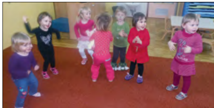
Rajanje otrok vijolične igralnice ob pustni glasbi