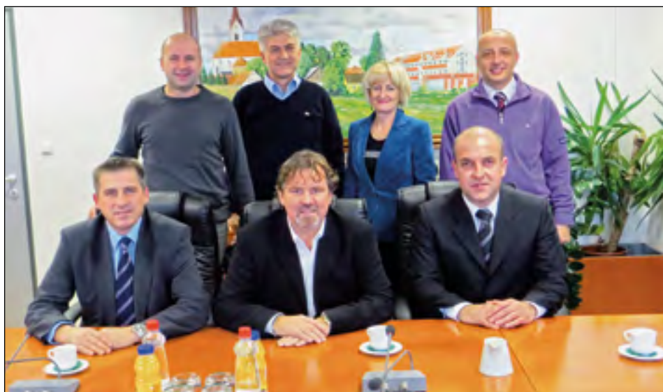
Obisk predstavnikov iz občin Sombor in Apatin v občini Hajdina

Občina Hajdina se je prijavila na razpis Evropa za državljane in bo poskušala tudi iz tega naslova pridobiti del sredstev za nekatere kulturne in športne prireditve.