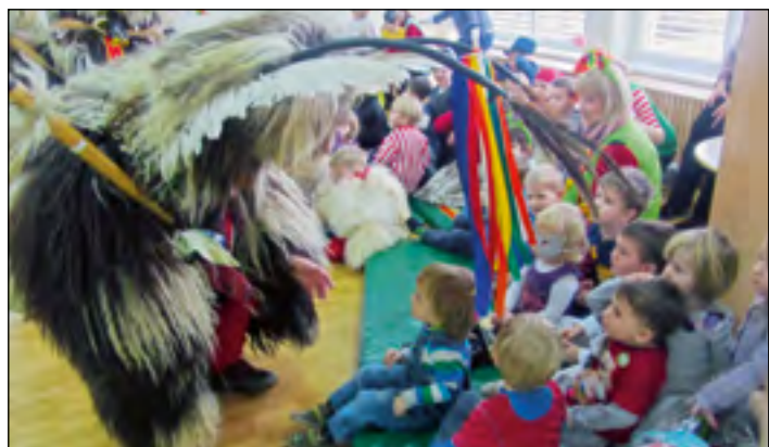
Razveselili in tudi malce prestrašili smo se korantov s Hajdine.