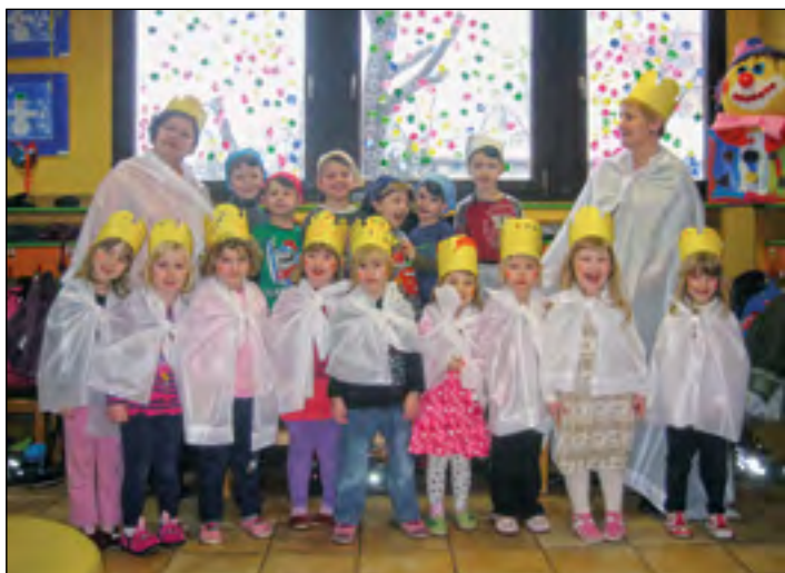
Maškare se predstavijo – mi smo kraljične in gusarji, zdaj pa le na ples v maskah.