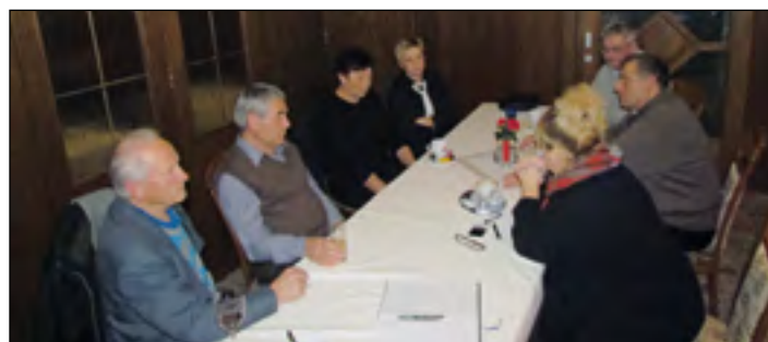
Utrinek s prvega sestanka s pletarji iz Hajdoš

Organizacija tovrstnega usposabljanja terja precej dela, zato so si udeleženci do naslednjega sestanka razdelili nekaj nalog, med katerimi je prav gotovo najpomembnejše, da preskrbijo potreben material – šibe, ki pa jih v glavnem kupujejo na Hrvaškem.