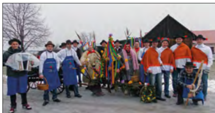
Skorbovski orači so bili v pustnih dneh povsod sprejeti z velikim veseljem in navdušenjem.

Skorbovski orači so se tudi letos na pustno soboto podali po vasi in zaorali prvo brazdo za dobro letino. Še prej so pripravili ter z zelenjem, pisanimi trakovi in rožami okrasili plug, »plužnice« in manjši star lojtrni voz.