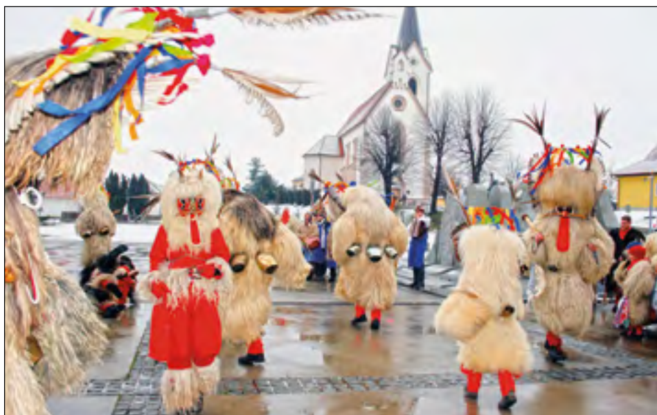
Za srečo in dobro v novem letu so prišli plesat, hkrati pa še odganjat zimo tudi koranti Te-De kluba Draženci.