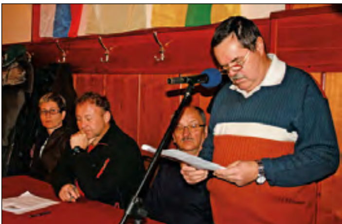
V petek, 22. februarja, so se člani PD Hajdina sestali na rednem občnem zboru.