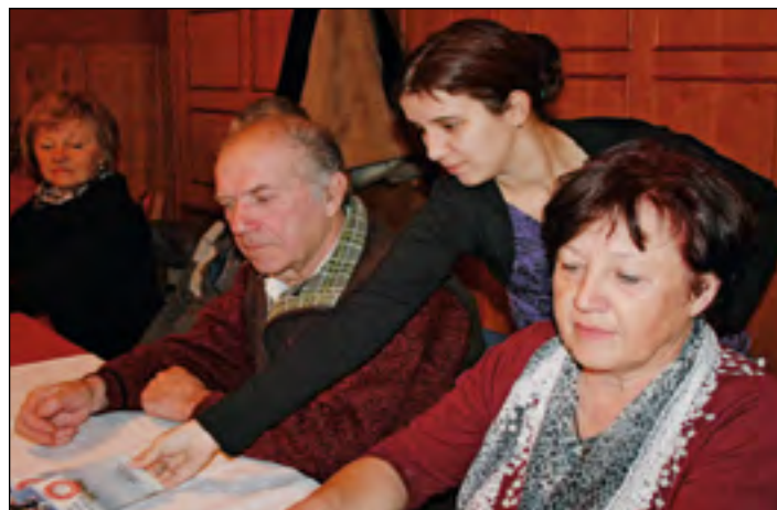
Planinsko društvo Hajdina je pripravilo bogat program izletov in pohodov v letu 2013. Zloženko so razdelili vsem članom, ljubiteljem pohodništva in tudi gostom.