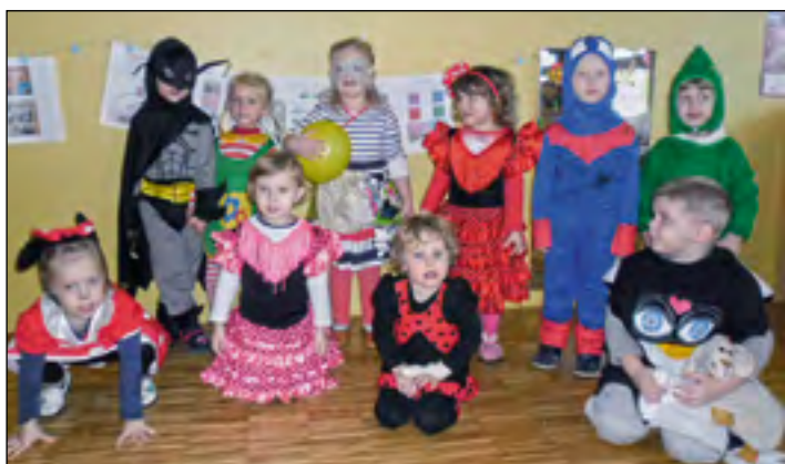
Pustne šeme iz modre igralnice