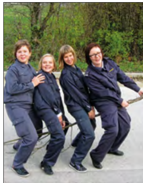
Uspešne pionirke PGD Gerečja vas z mentorico so se v Cerknici počutile prav domače.