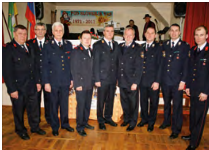
Novoizvoljeni upravni odbor PGD Slovenja vas, ki bo z delom nadaljeval na dosedanjih dobrih temeljih in uspešnem vodenju društva.