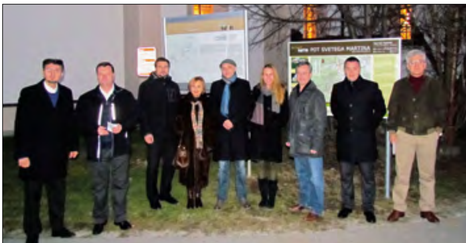
Delegacija pred tablo, ki označuje pot sv. Martina Tourskega.

V soboto, 12. januarja, je župnijo sv. Martina na Hajdini obiskala delegacija Evropskega kulturnega centra sv. Martin Tourski.