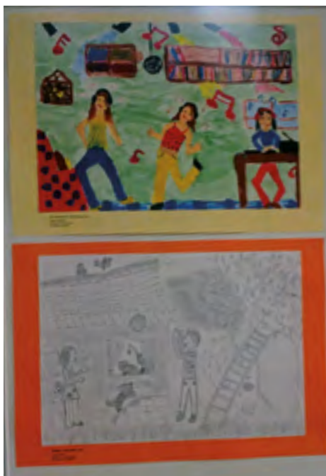
Nagrajeni risbici naših učenk – Zale Majhen in Tjaše Šterbal