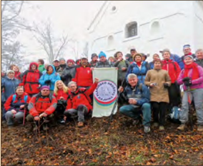
Pred cerkvijo na vrhu Ravne gore