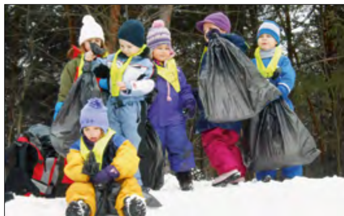
Zimske radosti otrok iz rumene igralnice – dričanje po hribu z vrečami je zelo zabavno.