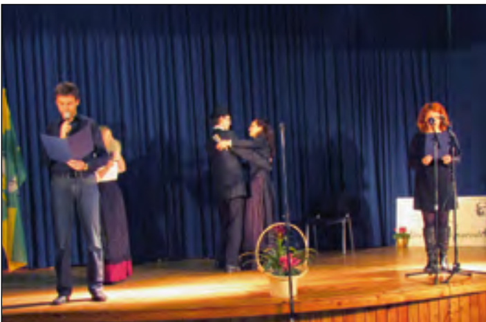
Znamenito Prešernovo pesnitev Povodni mož so predstavili recitatorji ŠUS teatra iz Dražencev.