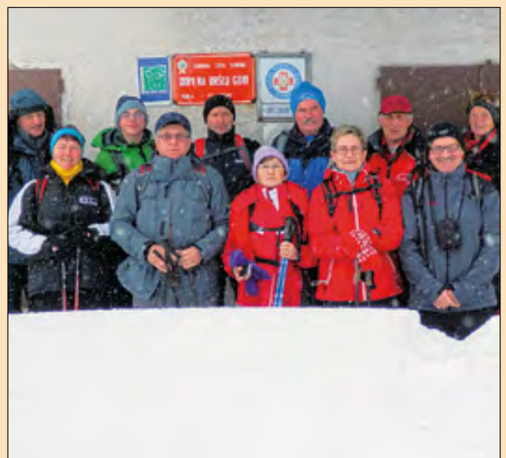
Pred kočjo na vrhu Uršlje gore