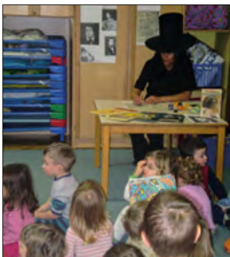
Otroci so ob slovenskem kulturnem prazniku spoznali lik Franceta Prešerna in njegova dela.