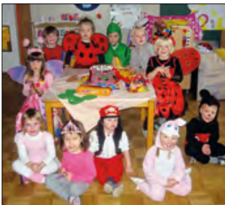
To je pravi rojstni dan, s torto in maskarami!

Kljub težkim družbenim razmeram stopamo v novo koledarsko leto optimistično. Otroci so s svojo neposrednostjo za starše in vzgojiteljice »naše skupno bogastvo« in neusahljiv vir moči in energije.