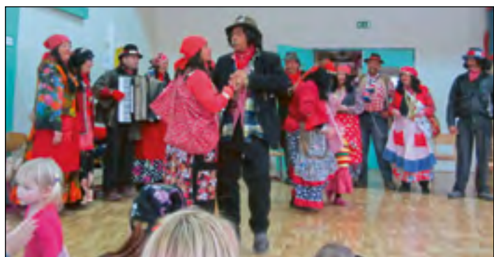
Zaplesali smo skupaj s cigani iz Dornave, ki so prišli v maskare v naš vrtec.