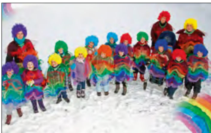
Otroci in vzgojiteljice rdeče igralnice našemljeni v mavrico