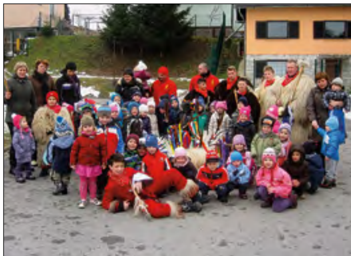
Koranti Etnografskega društva Koranti Hajdina so s svojim plesom preganjali zimo in strah otrok pred koranti.