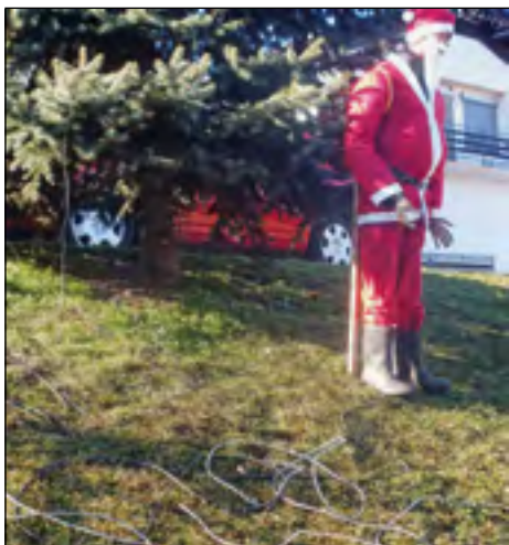
Tako je na silvestrovo v Gerečji vasi Božiček sameval v družbi kupa razrezanih električnih kablov.