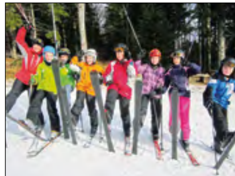
Zimski utrinki s Treh kraljev, kjer so januarja uživali tudi hajdinski šestošolci.

Šola v naravi mi je bila zelo všeč, kaj-