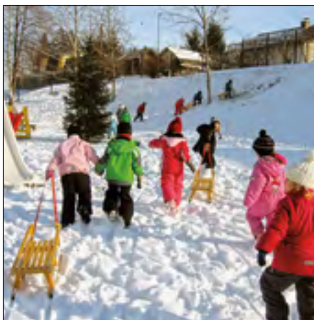
Juhu, končno sneg ... S sanmi na zasneženo igrišče in breg. Pravo zimsko doživetje za otroke.