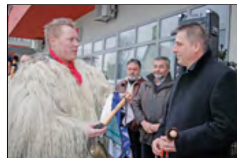
Ježevka hajdinskih korantov za župana, v spomin na pust 2013