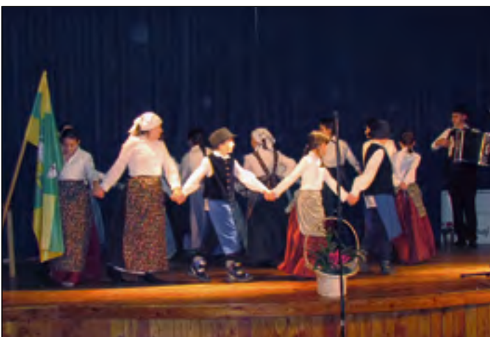
Domovina je povsod, kjer je človeku dobro. Naša domovina pa je naše veliko srce. In kjer je srce, kjer je lepa slovenska pesem, tam so tudi naši najmlajši – naša svetla bodočnost. Učenci OŠ Hajdina so ob prazniku kulture pripravili prijeten program. Zaplesala je tudi otroška folklorna skupina.