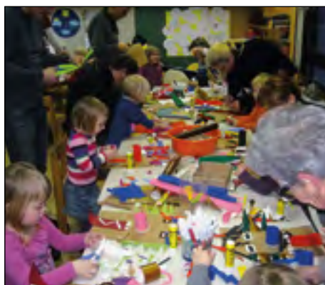
Izpod ustvarjalnih rok staršev in otrok so nastajali čudoviti kurenti.

Zima nas je letos bogato obdarila s snegom, česar so se otroci zelo razveselili. Uživali so v zimskih radostih: kepanju, sankanju, hoji po visokem sveže zapadlem snegu, kotaljenju snežnih kep in oblikovanju snežakov ter pridobili osnove smučanja vsi udeleženci smučarskega tečaja, ki ga je za otroke Vrtca Ptuj organizirala športna šola Juhuhu.