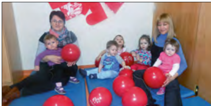
Otroci oranžne igralnice na dan ljubezni tik pred srčkovim plesom – saj smo sami srčki.