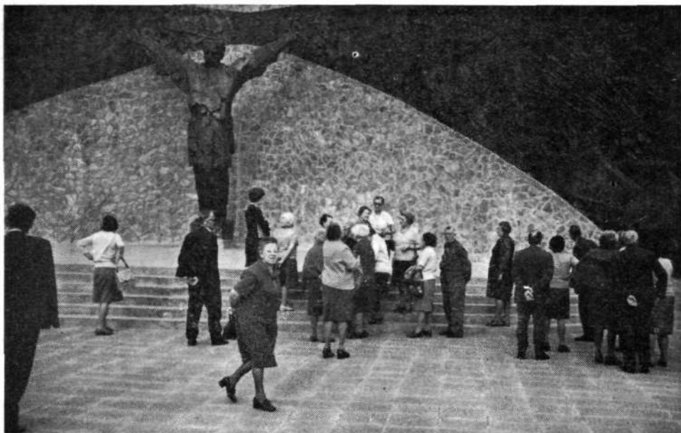
Pred Gubčevim spomenikom pri Gornji Stubici