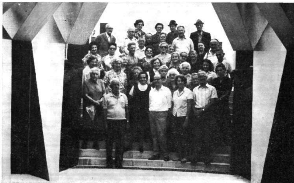
Izletniki med stebrovjem spomenika v Gonarsu.

jezera Črnave. Nadaljnji postanek je bil v vasi Adergas, da smo si ogledali Kremser Schmidtove in Metzingerjeve slike. Mimo Strmola, skozi Cerklje, Moste, Križ, Kamnik, Stranje in Stahovico nas je pot pripeljala v Kamniško Bistrico, kjer je bil zadnji postanek v Bistriškem domu. Posebna mikavnost tega izleta v neznano je bila, da so udeleženci po nekaterih vodnikovih podatkih več ali manj uspešno ugibali smer in postanke izleta.