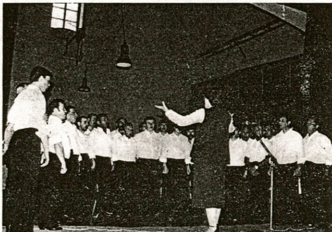
Pevski zbor »Solidarnost« iz Kamnika je prispeval svoj delež k prijetnemu počutju upokoјencev

minilo, saj smo si imeli toliko za povedat, za celo leto nazaj. Hvala vam vsem za lep dan, hvala vam, ker se vsako leto spomnite na nas. Vsem vam želimo obilo uspehov za vnaprej in pa, če bomo le pri zdravju, nasvdienje prihodnje leto. Upokoјenci