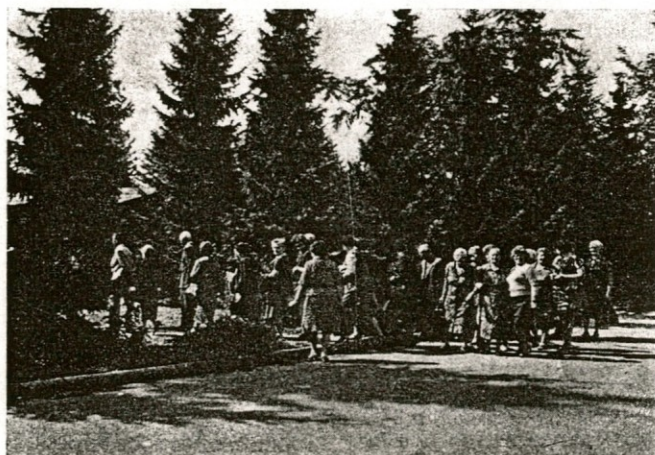
Večina upokoјencev si je z zanimanjem ogledala proizvodne prostore DO

vidi vsak dan, pač, nekaj vsakdanjega. Obnovljena oplemenitilnica oziroma barvarna se ne da primerjati s tisto včasih. Res je lepo in prav je tako, da vedno kaj novega naredite. Po ogledu tovarne in kratkem klepetu z delavci, smo počasi odšli do dvorane, kjer so nas že