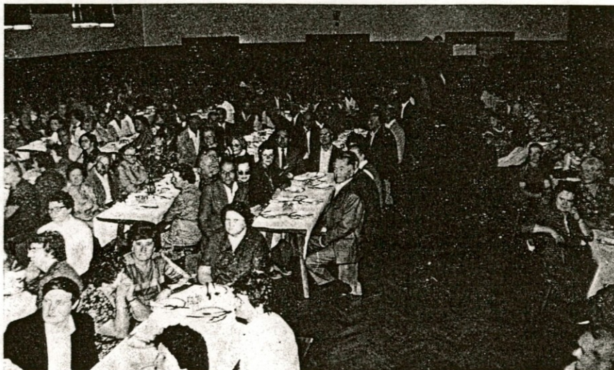
Pozorno so sledili kulturnemu programu

Po deževnem tednu in meglenem jutru nas je v dopoldanskih urah pozdravilo sonce, tako da je bilo srečanje upokoјencev pred našo tovarno še bolj prisrčno. Po enem letu smo se spet zbrali, tokrat tudi zato, da si ogledamo tovarno. Ko je človek že toliko let v »penzjonu«, prav rad spet malo zaide v obrate, kjer je delal nekoč. Po prvih pozdravih in objemih, ko smo morda po dolgih letih spet videli sodelavca, so nas obratovodje in tehnologi pospremili po tovarni. Kar precej ste naredili v zadnjih desetih letih, od predilnice, novih tkalskih strojev, do oplemenitilnice. Težko se primerja delo mokre predilnice in delo sedajšnje nove, vse v ploščicah in z neprimerno boljšim zrakom, kakor je bil nekoč. Tudi novi tkalski oziroma pletilni stroji, kakor jim pravite, so zelo lepi in ko smo to omenili tkalki, ki na njih dela, je rekla, da so zanjo, ker jih