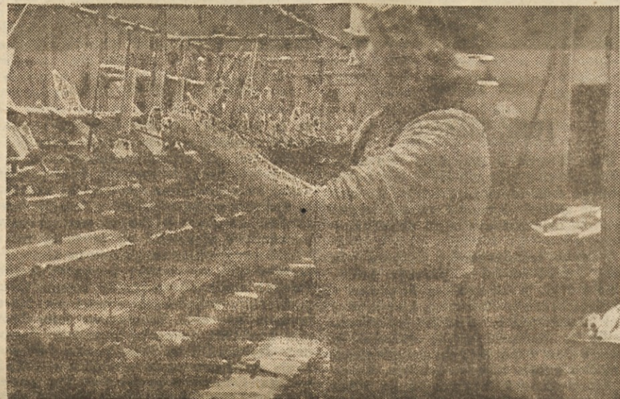
Sprejemanje in uresničevanje konkretnih individualnih obveznosti bo vsebina našega tekmovalja v počastitev II. kongresa Zveze sindikatov Slovenije