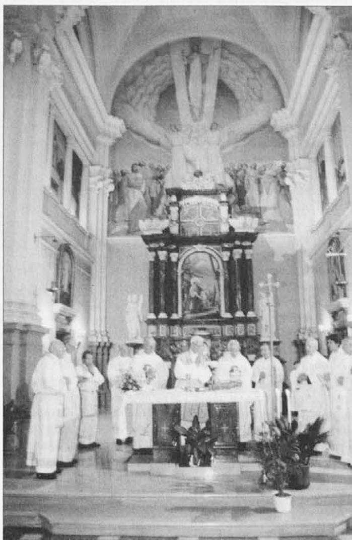
Mašniki z jubilantom med slavljem pod Kraljevim obokom

Omeniti je treba še sedanje župnišče. Štandrež je sicer imel svoje župnišče, toda bilo je daleč od cerkve. Toda zgodilo se je, da je bila naprodaj hiša na trgu pred cerkvijo, kjer je bila od