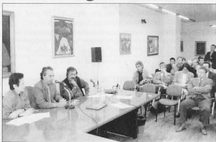
Med tiskovno konferenco