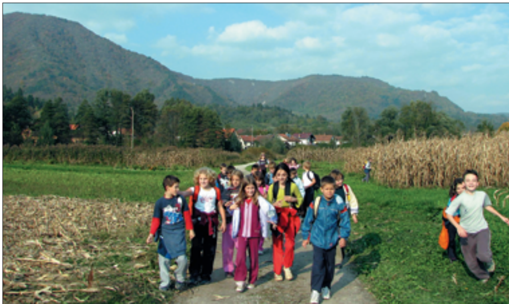
Slika 2: Pogled proti severovzhodnemu delu Kostelske kotlinice.

Medtem ko je dolina ponekod v tektonsko neporušenih območjih ostala zelo ozka in se prepadna kamnita pobočja dvigujejo skoraj iz struge reke Kolpe, je drugod, v tektonsko porušeni delih, prišlo do obsežnih razširitev. Ena od večjih razširitev je Kostelska kotlina, na dnu katere deluje v okviru CŠOD Dom Fara (Gregorčič 2006). Zaradi lažjega razumevanja didaktičnih pristopov bodo na kratko opisane hidrološke, geomorfološke in geološke značilnosti površja v bližnji okolici Doma Fara. Teh učencem ne razlagamo na tak način, kot bo povedano v nadaljevanju. Razlago prilagodimo njihovemu načinu razmišljanja in predznanju, kar bo podrobneje prikazano v naslednjih poglavjih.