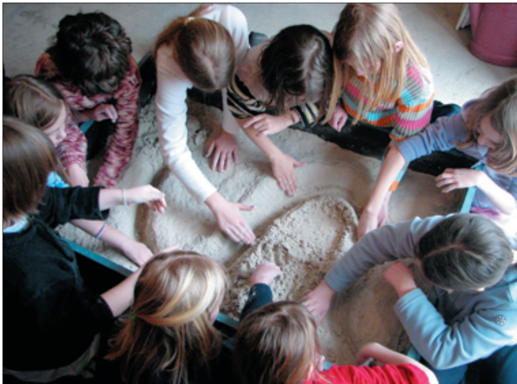
Slika 3: Skupina učencev izdeluje model meandrirajoče reke.